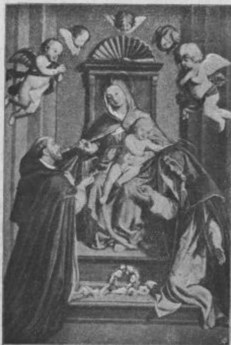
Kralica najszvetejszega roznogavenca.

5. szkrivoszt: Ki je za nész na krizs razpéti bio. Pri pétoj szkrivosztli szí premiszlmo, kak rad má