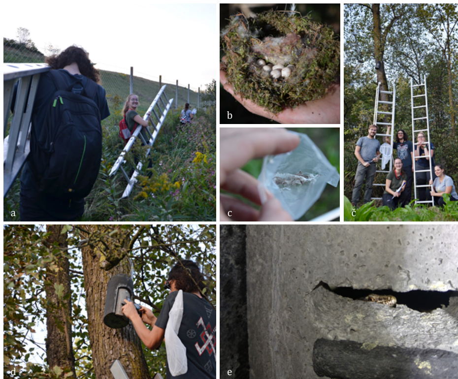
SLIKA 5. Jesenski pregled netopirnic na Ljubljanskem barju: a) prebijanje preko invazivk, b) opuščeno ptičje gnezdo z jajci, c) olevelk kuščarice, najden v netopirnici, č) skupinska, d) fotografiranje največjega presenečenja v netopirnicah in e) posneta fotografija kukajoče pozidne kuščarice ( Podarcis muralis ).

Rezultati pregledov netopirnic so zelo vzpodbudni, saj kažejo, da zatočišča netopirji uporabljajo in se vanje tudi vračajo.