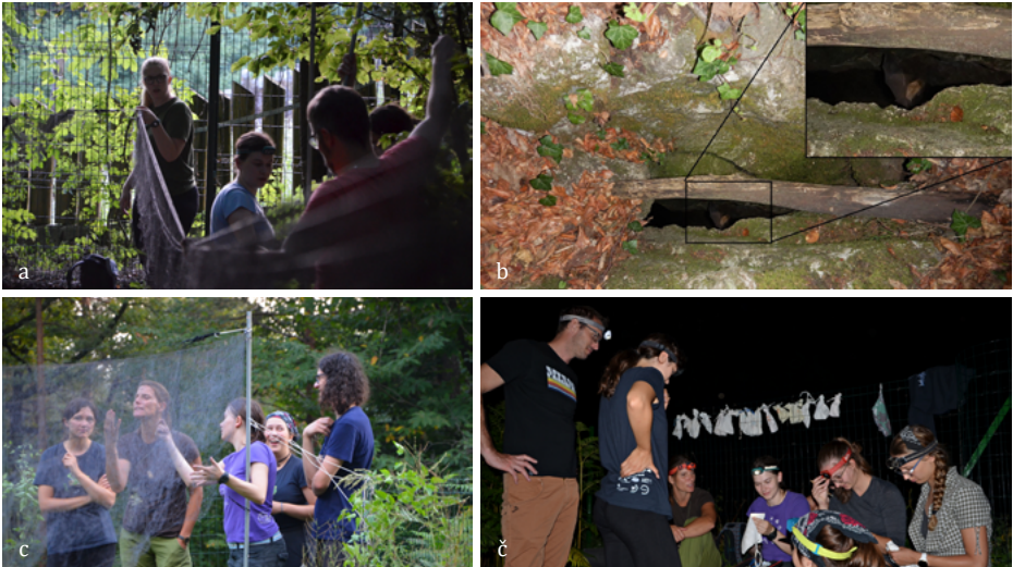
SLIKA 9. a) Postavljanje mrež nad mlako pri ljubljanskem ZOO (foto: Simon Zidar), b) letajoči mali podkovnjak ( Rhinolophus hipposideros ) na vhodu v Brezno 1 pri Dovčarju (foto: Eva Pavlovič) c) postavljjanje mrež za lov netopirjev v Mostecu, č) določanje ujetih netopirjev - v vrečkah zadaj čakajo netopirji na meritev (foto: Simon Zidar).

netopirja ( Eptesicus serotinus ), z ultrazvočnim detektorjem pa smo potrdili tudi prisotnost malega netopirja ( P. pipistrellus ).