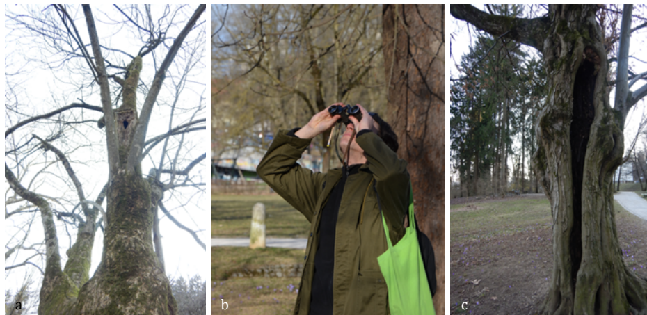
SLIKA 12. Pregledovanje drevesnih dupel: a) duplo visoko v krošnji (foto: Eva Pavlovič), b) pregledovanje višjih delov drevesa za potencialna zatočišča z daljnogledom (foto: Simon Zidar), c) drevo z več primernimi dupli in špranjami (foto: Eva Pavlovič).