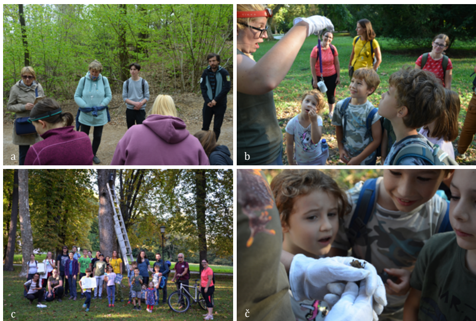
SLIKA 6. Udeleženci pregledov netopirnic za javnost: a) na spomladanskem pregledu v parku Tivoli, b) navdušeno opazovanje tehtanja najdenega netopirja, c) jesenskega pregleda netopirnic se je udeležila pestra in številčna družčina, č) navdušenje nad drobnim netopirjem ( Pipistrellus pygmaeus ).

Netopirji so živali, ki zaradi svoje skrivnostnosti ljudem pogosto vzbujajo strah. Ravno zato se člani društva tekom različnih izobraževalnih aktivnosti trudimo razbijati mite in predsodke, povezane z netopirji. Javni pregled netopirnic je ena izmed dejavnosti, kjer lahko širši javnosti predstavimo ohranitvene ukrepe za varstvo netopirjev, hkrati pa vsem udeležencem približamo te skrivnostne letalce. Spomladi in jeseni smo tako izvedli preglede za javnost v Krajinskem parku Tivoli, Rožnik in Šišenski hrib, na Koseškem bajerju in Ljubljanskem gradu, razveselili pa smo se vsakega, ki je prišel mimo. Najbolj smo bili veseli pozitivnega odziva udeležencev, predvsem najmlajših, prav tako pa je dodatna pomoč predvsem mlajših prišla prav pri nošenju mreže. Udeleženci so se tako spoznali s terenskim delom, z določanjem vrste netopirja ter obročkanjem.