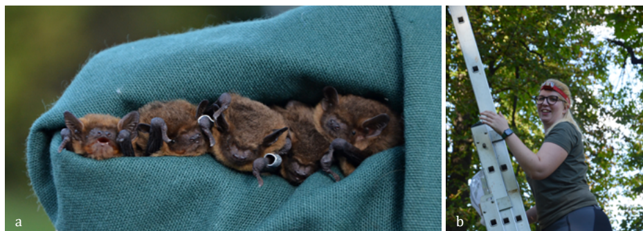
SLIKA 4. a) Pet od gruče osmih drobnih netopirjev ( Pipistrellus pygmaeus ) iz nove netopirnice ob Tivolskem ribniku, b) Pia po spustu z lestve, zadovoljna nad netopirskimi gosti.

Zelo vzpodbudni so tudi rezultati iz novih netopirnic. V netopirnici, nameščeni ob Tivolskem ribniku, smo našli skupinico osmih drobnih netopirjev. To pomeni, da so novo netopirnico netopirji sprejeli za bivališče že tri mesece po postavitvi.