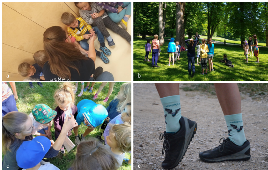
SLIKA 8. Delavnice za vrtčevske otroke: a) spoznavanje z netopirjem (foto: Ana Skledar), b) telovadba “po netopirsko” in ogled nameščenih netopirnic v parku Tivoli (foto: Liza Trebše), c) radovedno opazovanje tehtanja netopirja (foto: Ana Skledar). č) Nove netopirske nogavice širijo glas o pomenu varstva netopirjev (foto: Simon Zidar).