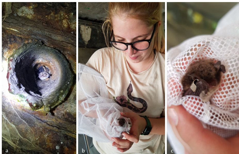
SLIKA 11. a) Netopir v odtočni cevi pod mostom nad Malim grabnom, b) Pia in ujet netopir iz cevi izpod mosta, c) čemeran odrasel samec obvodnega netopirja ( Myotis daubentonii ), ki je bil obročkan leta 2012.

Netopirji uporabljajo različna zatočišča, kjer se skrivajo tekom dneva. Mostovi predstavljajo nekoliko drugačno zatočišče, ki ni značilno za vse pri nas živeče vrste netopirjev. V okviru projekta smo pregledali vse mostove v občini, kjer so bili v preteklih projektih zabeleženi netopirji. Skupno smo pregledali osem mostov, najštevilčnejša vrsta je bil obvodni netopir ( M. daubentonii ), poleg tega pa smo v zapuščenih ceveh na spodnji strani mostu opazili tudi večje vrste rodu Myotis .