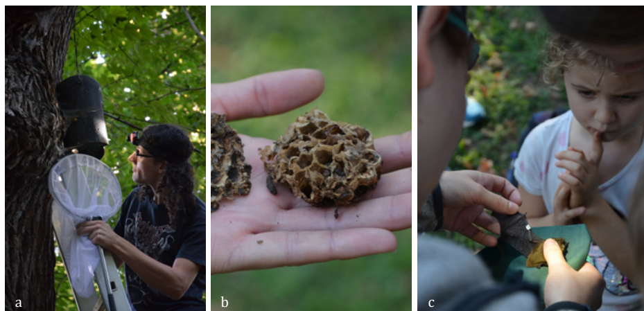
SLIKA 3. Jesenski pregled netopirnic v parku Tivoli in na Šišenskem hribu: a) Samo preverja, kaj je v netopirnici, b) opuščeno sršenje gnezdo iz ene od netopirnic, c) zbrano opazovanje z obročkom označenega drobnega netopirja ( Pipistrellus pygmaeus ).

Jesenski tereni so nam razkrili boljšo obiskanost netopirnic. V parku Tivoli smo prvič pregledali še pet v letu 2022 na novo nameščenih netopirnic. Pregled starih tivolskih netopirnic je razkril prisotnost gvana v petih od šestih netopirnic, v treh pa tudi prisotnost skupno štirih drobnih netopirjev. Vsi so bili že obročkani in v istih netopirnicah smo jih predramili že na preteklih pregledih – tri jeseni 2021, enega pa spomladi 2022. V netopirnici z oznako 03-15 v parku Tivoli je bilo najdeno gvano večje velikosti, zato lahko z veliko verjetnostjo trdimo, da so netopirnico kljub odsotnosti ob pregledu tudi letos uporabljali navadni mračniki ( Nyctalus noctula ).