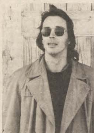
»Nemaš človeka, ki te ne zasleduje.«

Nemara kdo pomisli, da gre vnovič za napihovanje nekli mladincev. Daleč od tega. Gre za težnjo po polnem življenju, za težnjo po prijetnem vonju v avtobusih, kar odseva odnos do okolja. Če je to mesto, toliko bolje, in če se tega še kdo nalezze — prav nič ne bo narobe. In na tej točki je Split prisposoda. Žal samo to.