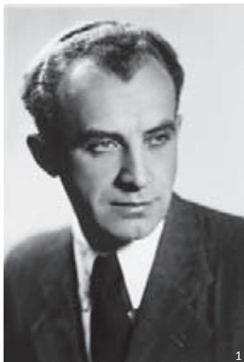
Sl. 1: Arhitekt Feri Novak, 4. septembra 1941.

Članek se z naslovom navezuje na pariško obdobje arhitekta Ferija Novaka (1906–1959) 1 , vendar se osredotoča tudi na njegova šolska in študijska leta. Nekoliko bolj podrobno sta predstavljeni prvo obdobje – čas šolanja, sprva na Stavbno rokodelski šoli (SRŠ) 2 in kasneje na Tehniški srednji šoli v Ljubljani (TSS) 3 , ki še ni bilo raziskano – ter tretje obdobje – čas izpopolnjevanja v Parizu. Z njima sem se že ukvarjal. Nekoliko manj popolno sta predstavljeni, prav zaradi pomanjkanja podatkov, drugo obdobje – čas študija na Dunaju na Akademiji za likovno umetnost (AdBK) 4 – in četrto obdobje – čas študija na Tehniški visoki šoli (THS) 5 , prav tako na Dunaju. Vsa štiri obdobja so pomembna za razumevanje arhitektovega dela in pomena v Prekmurju, Sloveniji in Evropi.