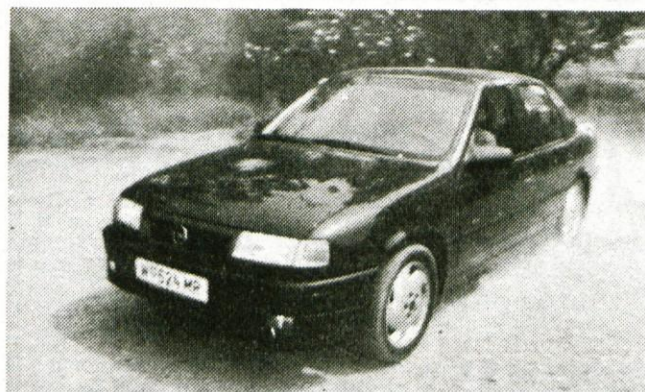
Opel vectra turbo 4x4: volk v ovčji podobi.

Nasploh pa ta Vectra navdušuje z obiljem serijske opreme. Poleg elektrificiranih stranskih stekel in bočnih ogledal si je dovod zraka mogoče urediti tudi z ročno nastavljamim strešnim oknom, med dodatke pa sodijo tudi srednje luči za meglo. Prtljažni prostor je bolj športno kupejevski kot pa limuzinski. Ob