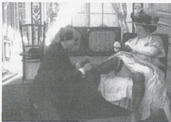
Scena iz filma Erotika obuvala