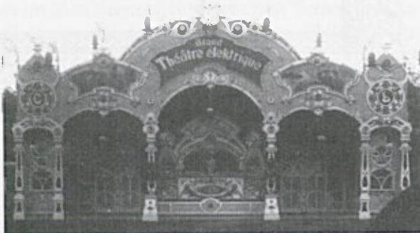
Eden prvih potujočih kinematografov (1908)

Na samem začetku pa film zaradi nerazširjenosti še ni predstavljal takšne nraavnstvene nevarnosti. Vendar takšno stanje ni trajalo dolgo.