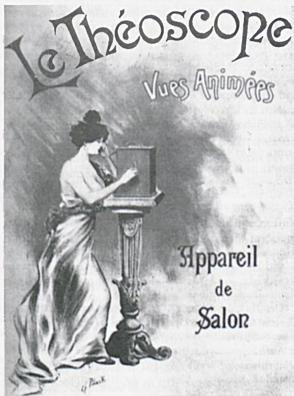
Domači 'kino' 2

Prisotnost erotičnih prizorov v različnih medijih ni več, vsaj ne v omembe vredni meri, pred-