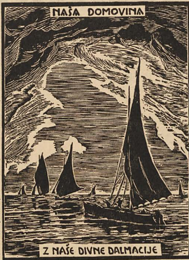
Z NAŠE DIVNE DALMACIJE

ne more biti prav nobenega pardona za tiste, ki so zatajili svoj narod izven območja fašistovskega pritiska. Na žalost tudi tu v tujini, naša slovenska kolonija ni bila obvarovana takih nečastnih izjem. Imamo tu, resda zelo majhno število Slovencev in tudi Slovenk, ki so svojemu narodu pokazali hrbet, ki pripovedujejo: kaj naj storim s slovenskim jezikom, ki je samo za kmeta in dekle? Kakor, da bi tak človek sam ne izhajal s slovenske kmečke zemlje, ki je rodila in hranila nas vse. Ali ve tak pokvarjenec, da je slovenski jezik po svojem bogastvu in svoji mehki zvočnosti najlepši jezik na svetu? Ali je tak človek sploh kdaj prečital lepo slovensko knjigo? Ali se je kdaj potrudil, da bi svojo govorico približal književnemu jeziku, da bi opuščal tujo navlako laških in nemških besed? Ne tega ni storil, kajti Bog sam mu je tako slabo osolil možgane, mu povodenil voljo in značaj, da je za skorjo suhega kruha prodal sebe in svoj jezik tujcu. Ali ti maloštevilni izobčenci našega naroda so šli še dalje. Tudi danes, ko je fašizem pokazal vso svojo zločinsko naravo, tudi danes, ko se je njegov laški gospodar na življenje in smrt zvezal s