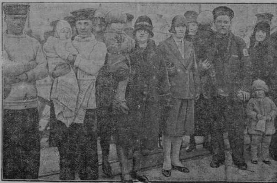
Nekaj mornarjev angleške podmornice »Poseidon«, ki se je potopila na Kitajskem. Na sliki vidimo par mornariških družin kratko pred odhodom podmornice iz Angleške na Kitajsko.