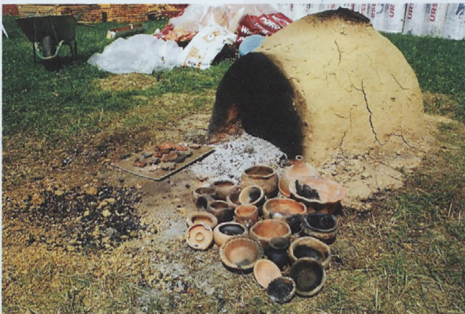
Rekonstrukcija keltske peči je prestala žganje, v njej so dosegli visoko temperaturo, prav tako pa so vse posodice udeležencev ostale cele