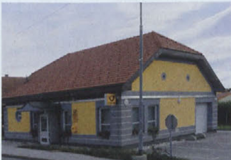
Nova pošta v Središču ob Dravi je bila zgrajena leta 2004 in se nahaja v samem centru kraja