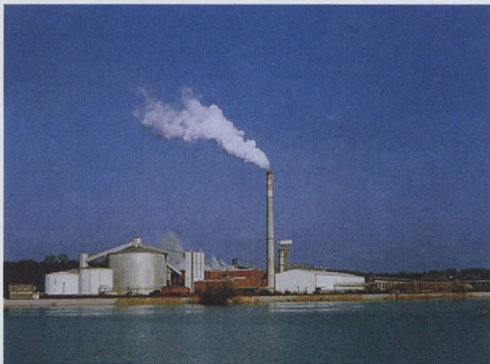
Zgodovina nam ne bi odpustila, če ne bi storili vsega, da ohranimo proizvodnjo sladkorja v edini tovrstni tovarni v državi