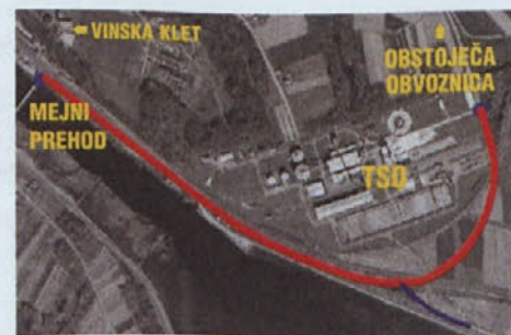
Vzhodna obvozna bo ob železniški postaji tekla mimo TSO in se na vzhodu Ormoža priključila obstoječi obvoznici

stanovanjskih objektov. Predvideno ureditveno območje, ki se bo urejalo z lokacijskim načrtom, leži med mestno cesto 304-361 in vinsko kletjo Ormož na zahodu, mestno cesto 304-371 in naseljem Dolga lesa na vzhodu ter zbirno mestno cesto 303-031 na severu.