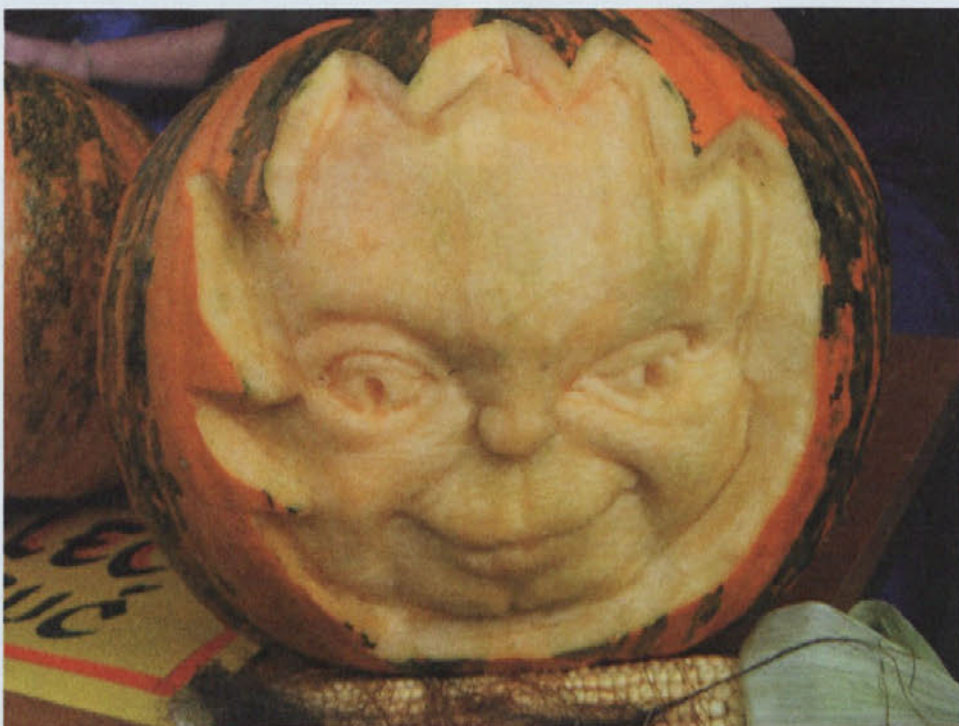
Dan odprtih vrat bo tudi letos predstavil umetniške stvaritve iz buč

Informacije o prireditvah in dogodkih v občini Ormož lahko najdete na spletnem portalu www.ormoz.si .