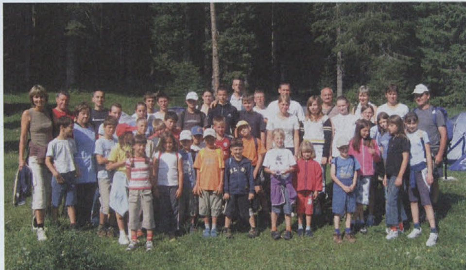
Vesela družina na taboru na Pokljuki, ki je tudi letos prišla domov polna nepozabnih spominov