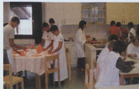
Prostorna in sodobno opremljena gospodinjstvo učilnica v Ormožu že navdušuje tako dekleta kot fante