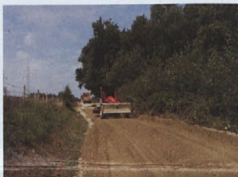
Lokalna cesta v Lahoncih je trenutno eno veliko gradbišče, saj za njeno modernizacijo že potekajo zemeljska dela, odvodnjavanje, gradnja nasipov in priprava tamponske plasti iz gramoza. Skupaj bo obnovljenih približno 2,5 kilometra cest.