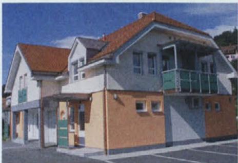
V novem poslovno stanovanjskem objektu v Podgorcih bodo 4 stanovanja, prostori krajevne skupnosti in predvidoma tudi pošta

štiri stanovanja. V teh dveh krajih so v zgrajenih objektih tudi prostori Telekomu in krajevne skupnosti, v Ivanjkovcih pa še splošna zdravstvena ambulanta. V pritličju obeh objektov so poslovni prostori, kjer sta predvideni novi pošti.