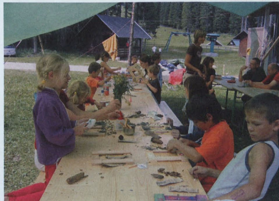
Otroci so risali, lepili, izdelovali iz gline ... kratka, bilo je veselo in ustvarjalno