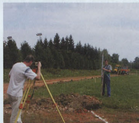
Izvajalci del bodo na novem stadionu zgradili zaključne elemente steze za skok v daljino, betonsko jamo za vodno oviro, suvanje kroglice, odrivne deske za skok v daljavo in skok ob palici

V Mestni grabi je obnova atletskega stadiona v največjem zagonu. Potekajo pripravljala in rušitvena dela, izkopi in odvoz materiala. Do Atletskega stadiona Ormož se bo zgradila tudi povezovalna cesta, v dolžini 590 m, ki bo imela urejen tudi pločnik za pešce ter kolesarsko stezo, za katero že odvažajo material in izvajajo rušitvena dela.