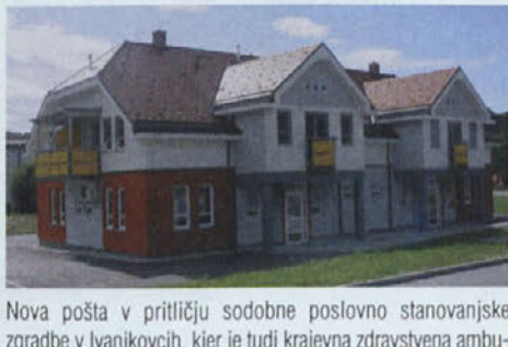
Nova pošta v pritličju sodobne poslovno stanovanjske zgradbe v Ivanjkovcih, kjer je tudi krajevna zdravstvena ambulanta, je zaživila februarja 2006. V nadstropju so štiri stanovanja, dva v lasti občine, dva pa je odkupil Stanovanjski sklad RS.