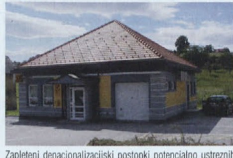
Zapleteni denacionalizacijski postopki potencialno ustreznih obstoječih zgradb, so pristojne prisilili v izgradnjo nove pošte v Miklavžu pri Ormožu, ki stoji v bližini kmetijske trgovine