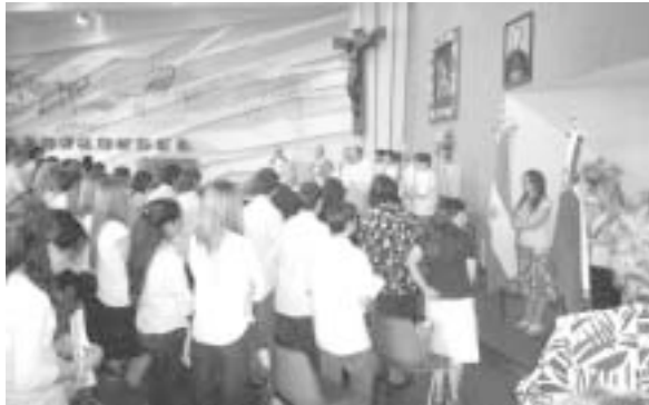
Sveto mašo je daroval nadškof Anton Stres

Popoldne se je začelo razgibano. Najprej so se dijaki zbrali po razredih, kjer so jim razredniki razdelili spričevala. Nato so skupaj s starši in profesorskim zborom odšli