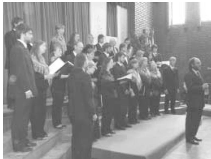
Zbor med nastopom

Naš pevski zbor nam je zapel štiri glasbe. Pevci so vstopili v dvorano v procesiji in peli Hnanačpachap , perujsko pesem prvih časov kolonizacije Amerike, zasnovano za slične praznične priložnosti; nato ljudsko iz Bile Injen čuea jti gna , sledila je pesem Mapucijev Moyi tun papa inché ; in končali so z mendoško Trabajos de la viña , cueca