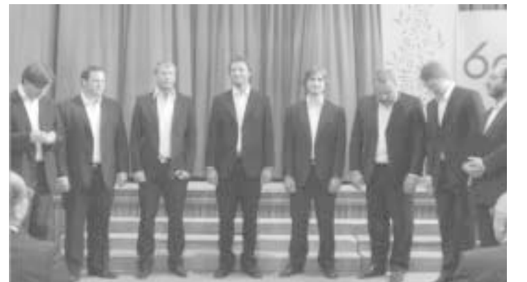
Tudi oktet je zapel

Končno je navzoče povabil napolniti kozarčke z mendoškim sladkim pridelkom in napili smo naši domovini, državi in vsem članom ter prijateljem slovenske skupnosti pod Andi!