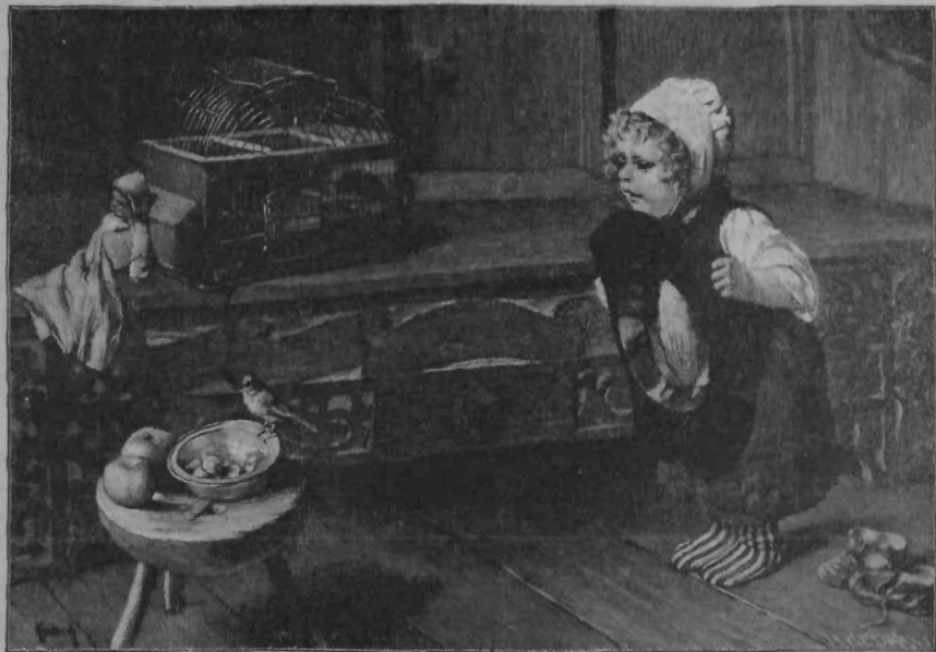
"Ptíček je ušel!"