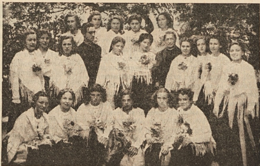
Skupina tržaških deklet v narodnih nošah.

Za kožnega raka pa sploh velja zlasti pri ljudeh, ki imajo že precej križev, da je tak rak dolgotrajen, samo pri miru ga pusti! Ne praskaj se tam, ne drgni kožo ob vsaki priložnosti ali če kaj premišljuješ.