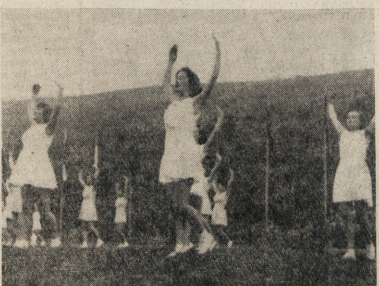
VALUJOCE KRETNJE MLADENK SO PONAZORILE RAHLO VALOVANJE VODA V STERGARJEVI SIMBOLICNI VAJI «PO JEZERU».