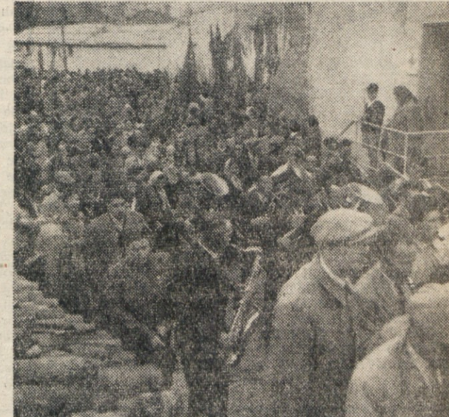
VES POPOLDNE SO SE STEKALE MNOZICE...

Proslavo je zaključil mimohod. Se enkrat smo zagledali: najprej pisane folkloriste, mornarje, potem udeležence točke «V boju», a za njimi so bržko stopale članice, nato najmlajši v svojih pisanih krojih. Ljudem se ni ljubilo zapustiti stadiona, postajali so po prostoru, se pomemkavali o pravkar minule nastopu mladosti in delali lepe načrte za prihodnjega. Večer je že legal na Sv. Ivan, ko so zadnji gledalci zapuščali telovadišče.