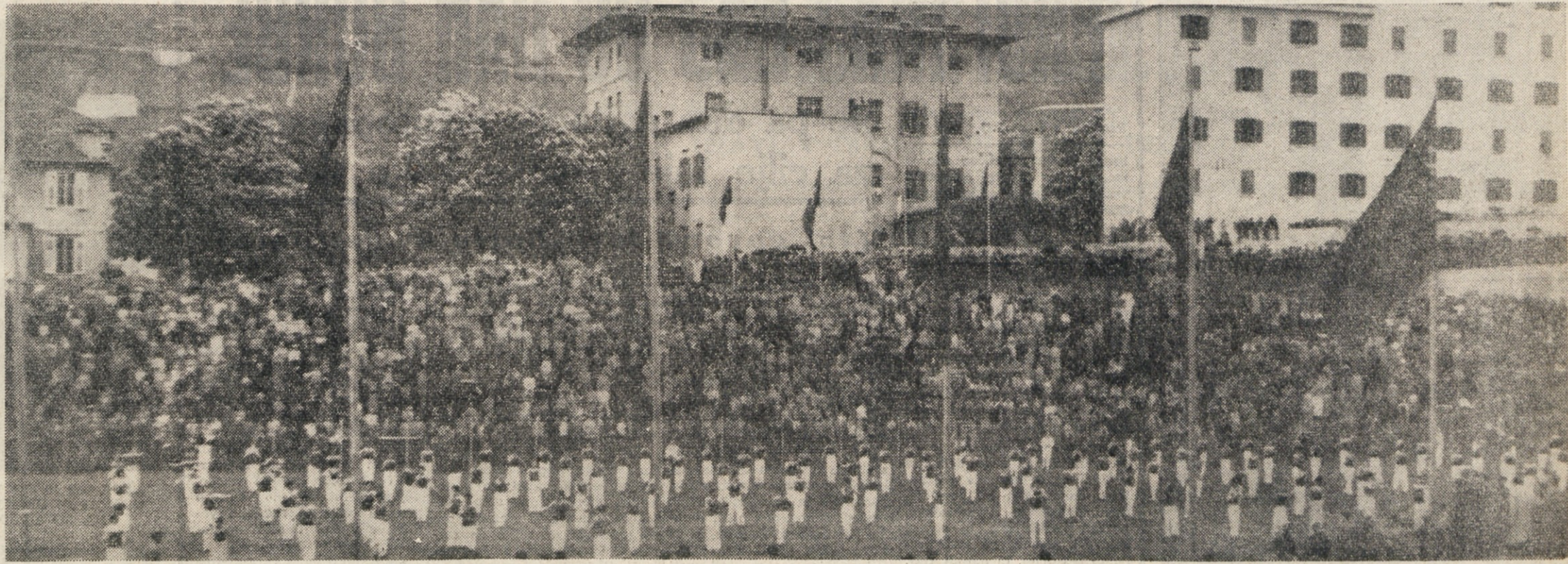
KAKOR VSAKO LETO SO TUDI ZA LETOSNJI 1. MAJ POHITELE MNOZICE NA STADION K SV. IVANU IN NAPOLNILE TRIBUNO IN OKOLICO TER Z ZANIMANJEM SLEDILE LEPI TELOVADBI