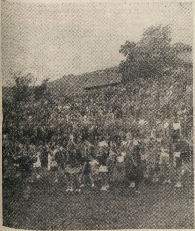
PO TELOVADISCU SE JE USUL DROBIZ...