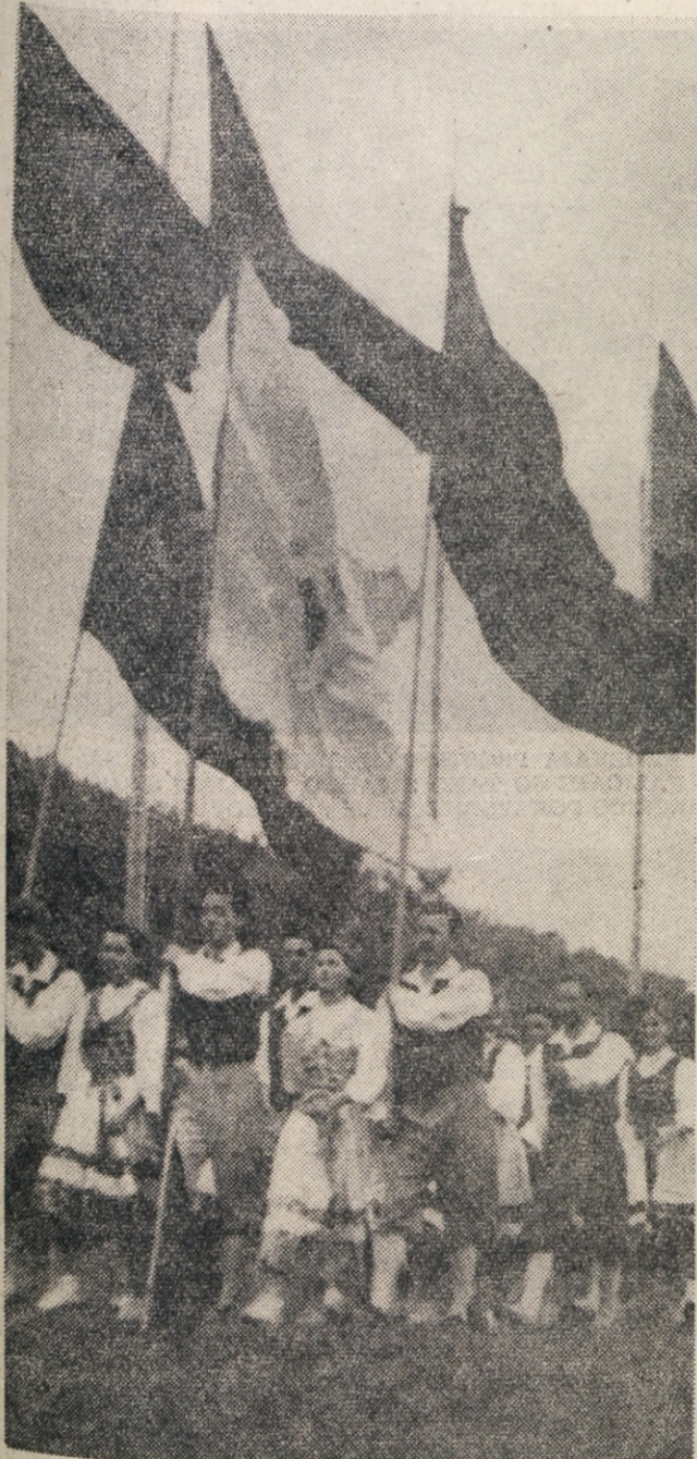
ZASTAVE NA CELU POVORKE TELOVADCEV.