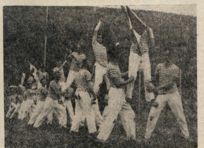
GOJENCI POMORSKE SOLE IZ PIRANA SO IZVAJALI MARSICEVO VAJO «MORNARJI» Z OBCUDOVANJA VREDNO SKLADNOSTJO.