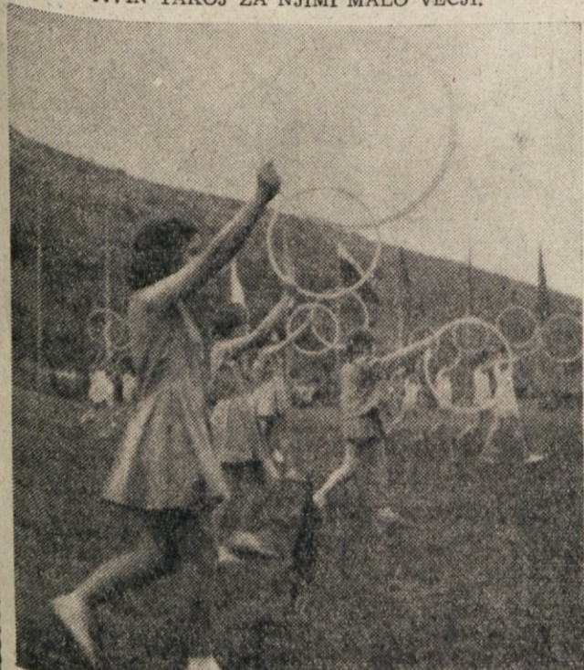
DECA IZVAJA POSEBNO VAJO Z OBROCI.