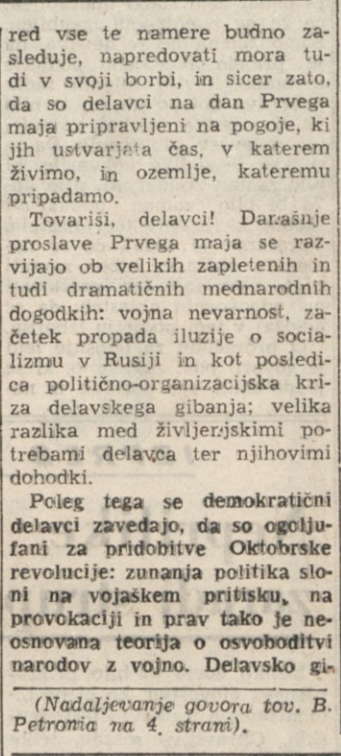
TOV. UKMAR IN PETRONIO GOVORITA