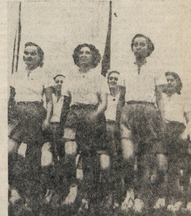
ČLANICE PRIHAJAJO NA TELOVADISČE.