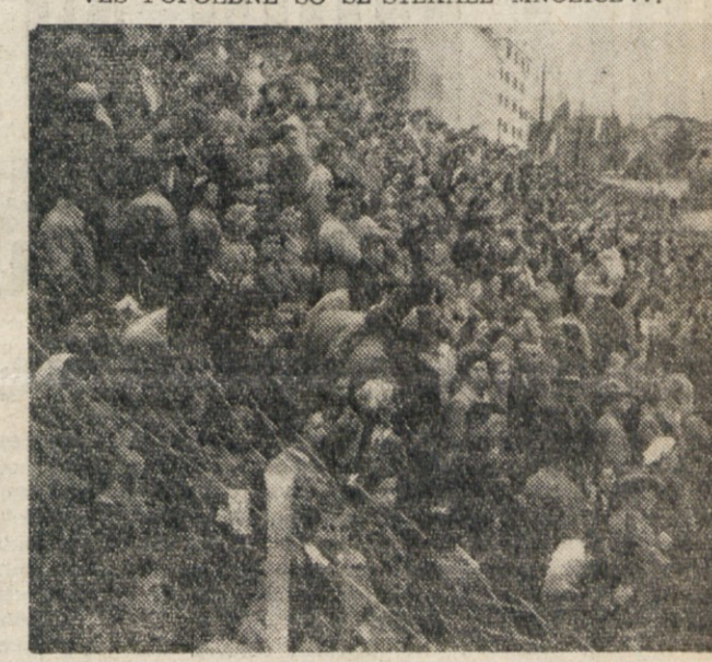
DOKLER NISO ZASEDLE POSLEDNJEGA SEDEZA