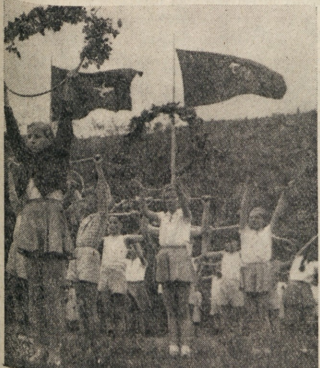
... IN TAKOJ ZA NJIMI MALO VEČJI.