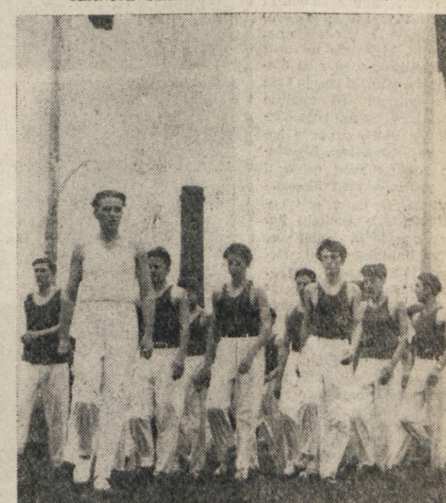
PO NASTOPU ZAPUSCAJO ČLANI TELOVADISČE.