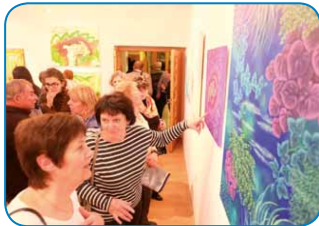
Umetnostni dogodek v monoštrskem Slovenskem domu je bil lepo obiskan