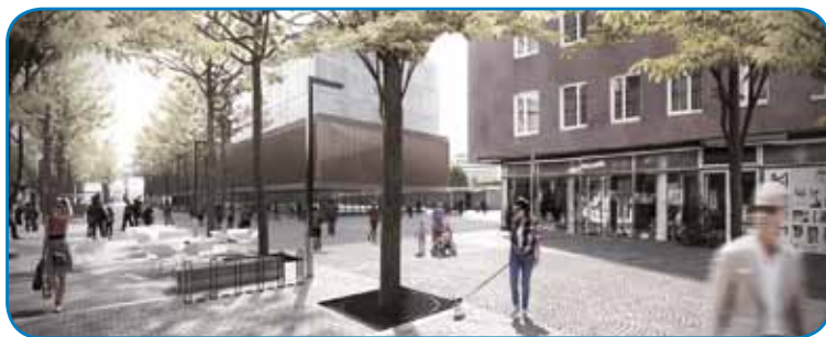
Tak bo že prihodnje leto pogled na del Slovenske ulice

no gibanje za pešce in kolesarje. Namesto dosedanjih dreves bodo zasadili dvojni drevored s 93. drevesi, medtem ko bodo dosedanja presadili k Soboškemu jezeru. Napovedujejo večje letne vrtove in organizacijo večjih prireditev. Prvi večji tovrstni projekt je bila ureditev drevoreda Primoža Trubarja, s katerim je na sodoben način povezana os evangeličanska cerkev in soboški grad. Tudi na tem prostoru je bilo doslej nekaj prireditev