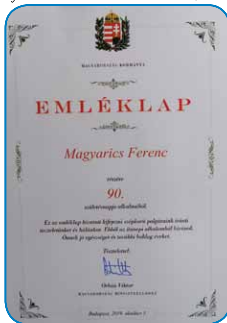
Ferko je za 90. rojstni den daubo spominsko listino od predsednika vlade Viktora Orbána

»Lejpa lejta mava, dapa dosta sva bila batažastiva, dja sem devet lejt ležala. Müši (ledvice) sem dolavrtgnjeno mejla, pa tau je niške nej vzejo napamet. Vajn zato sva telko lejt zadaubila, ka dosta sva delala pa sva nej mejla časa se s tejm spravlati, če tøj ali tam kaj malo boli.«