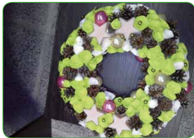
Nekateri so za abstraktne disko barve. Vrtnice so narejene iz filca. Storžki bora vso to živahnost umirijo.

nih venčkah in dekoraciji za novoletne praznike, saj nas veletrgovci že takoj po 1. novembru na trgovskih policah opozarjajo, da se prazniki