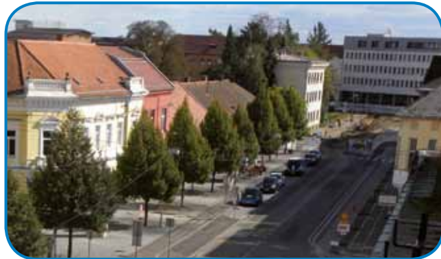
Z deli so začeli ob Slomškovi ulici; tudi drevesa, ki še rastejo, bodo »zamenjali« in bo zasajen nov drevored, 93 dreves, na obeh straneh ulice; po »korakih« se bodo pomikali po Slovenski ulici in s tem, kot zagotavljajo, najmanj motili utrip in življenje stanovalcev in trgovin

kega tonalita (mimogrede sem izvedel, da bodo enake kocke tudi na osrednjem trgu, ki ga obnavljajo v Mariboru). Na ta način bodo ustvarili prosto, var-