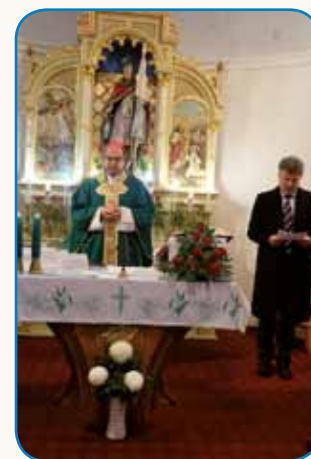
SOMBOTELSKI ŠKOF MAŠEVAL ... stran 9