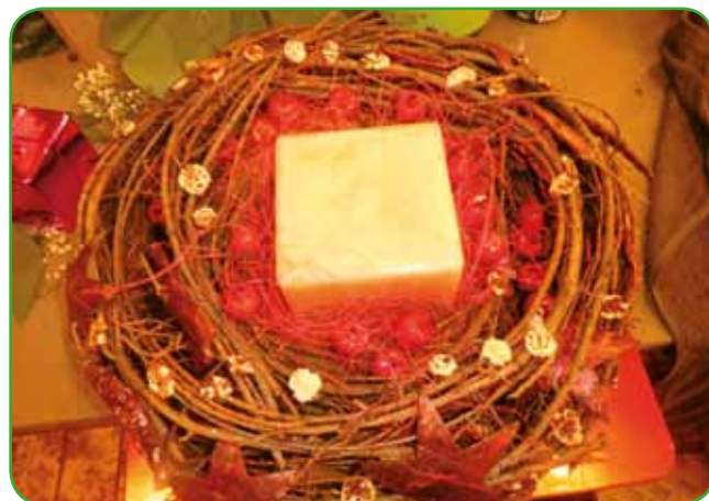
Klasična novoletna rdeča barva je vedno zanimiva. Je barva stalnica.

vi kot nalašč za ustvarjanje v toplih prostorih. Da nam bo prijetno, poskrbimo sami s kakšnim izdelkom, lahko pa