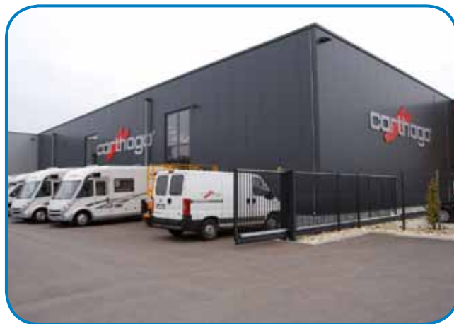
Firma Carthago ma okauli 800 zaposlenih

nam, vej pa je bilou pri njih delo predrago. In tak je té lastnik na kavi sedo s slovensko komercialistko, Prekmurko iz cankovske občine. Ona je zvala domau svojoga brata, pa ga pitala, če bi sto meu