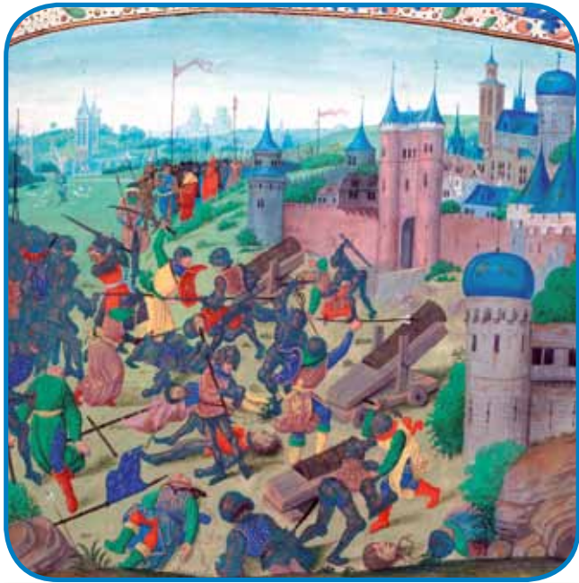
V bitki pri Nikopolji je septembra 1396 törski sultan Bajezid strašno dojbziu vogrsko-francusko-vlaške krščanjske šerege

Zmejs, ka so madžarski gospaudge eden drügoga vmardjali pa se samo za svojo bogastvo