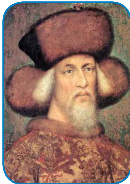
Žigmond Luksemburški je pau stoletja kralüvo Vogrskoj - samo Franc Jožef je biu duže krau, 67 leji

Žigmond je pleto evropsko politiko ino se vojskovau s Husiti, zmejs pa so z djuga pá prihajali črni oblacke. Kraug kauli Vo-