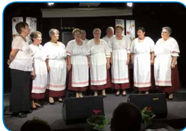
Vés Kapca je nej daleč od Lendave - njene pesmarce spejvajo pesmi svoje krajine