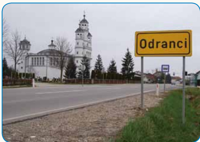
PRI VSAKŠOM ŠESTOM RAMI MAJO NEKŠO TABLO VŮDJANO stran 4