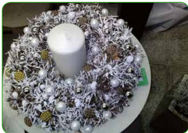
Venček, narejen iz turške leske (nabrane v bližnjem parku), dodani so svetleči gumbi in bele kroglice, ki sovpadajo z belino sveče in poprhom leske. Venček, primeren za advent, istočasno za novoletne praznike.

loženjem spreminjajo. V drugi polovici novembra že začnemo razmišljati o advent-