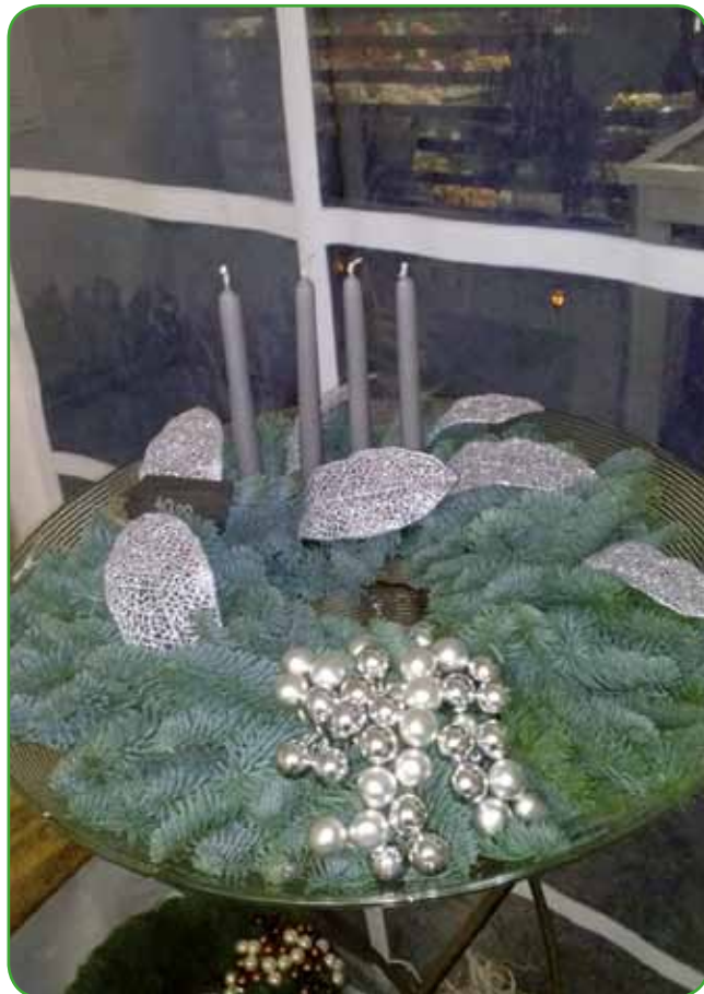
Dekoracija v obliki adventnega venčka. Barve so izbrane previdno s pogovorom: »Manj je več«.

Seveda smo s kotičkom očesa vedno tudi pri zunanjih rastlinah, vendar pa so mrzli dne-