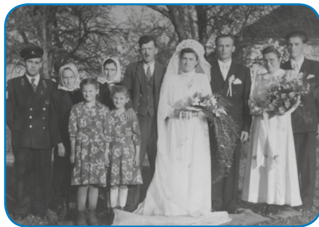
Zdavanjski kejp iz leta 1954

»Dosta vse kaj že ne ladam, dja sem že dvakrat na smrti bejo. Najprvin so se mi klobasi dolastavile, tašo bolezen (bolečino) sem emo, ka sem mislo, včasim mrdjem, drugo