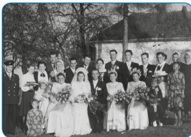
LEPAU SVA ŽIVELA stran 8