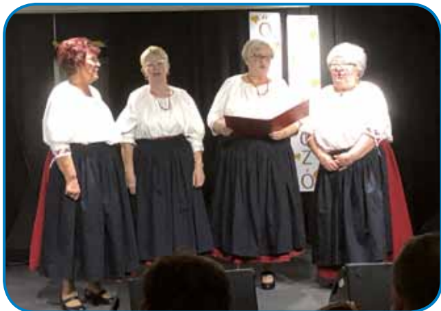
Kulturno društvo »Baráti Kör« má štteri pesmarce