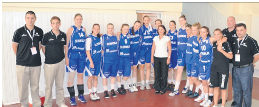
Naše mlajše košarkarice so v Romuniji izpolnile zastavljen cilj. Med njimi peterica celjskega Athletea.