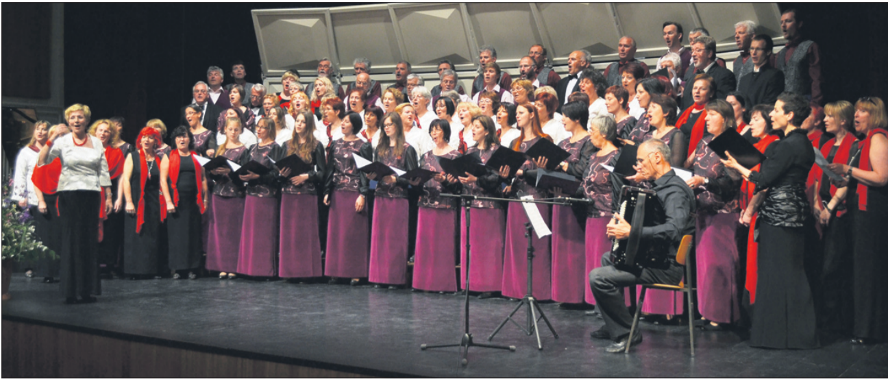
Mešani pevski zbor Orfej na gostovanju na Vrhniki v družbi ostalih nastopajočih