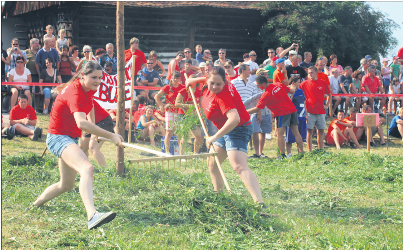
Mlade grabljice s Polzele so se naloge lotile precej resno, a so kljub temu morale priznati premoč domačinkam iz Marija Reke.