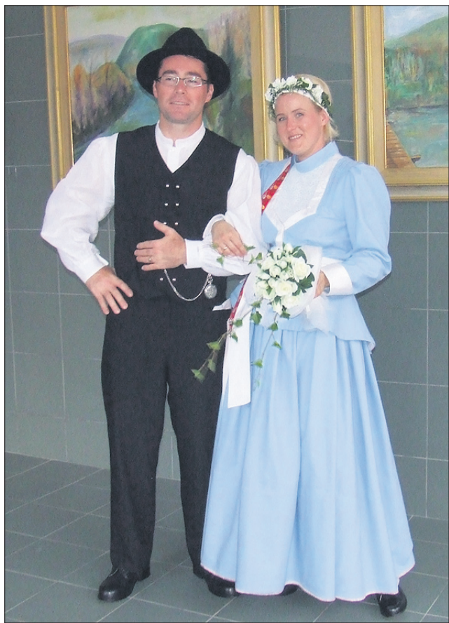
Predstavljeni kostum ženina in neveste je bil uporabljen na flosarski poroki leta 1907 na Ljubnem ob Savinji. Ženin in nevesta sta bila s Planine pri Ljubnem. Kostum je rekonstrukcija obstoječe obleke, ki spada v drugo polovico 19. stoletja in jo hrani Slovenski etnografski muzej.