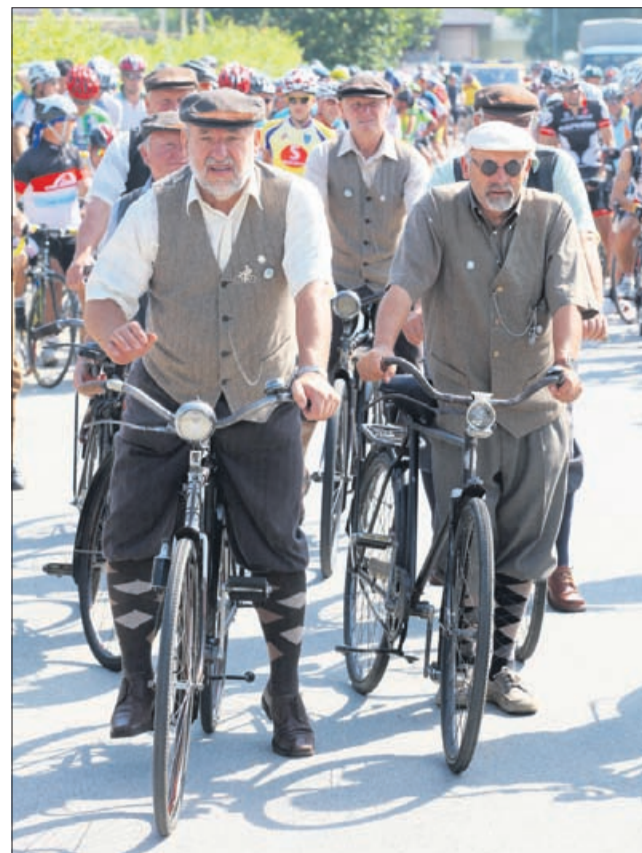
Maraton so popestrili člani Kluba starodobnikov Večno mladi Šentjur, ki so na ogled pripeljali stara kolesa. Prvi so se podali na pot, za njimi pa se je nagnetlo 320 maratoncev.