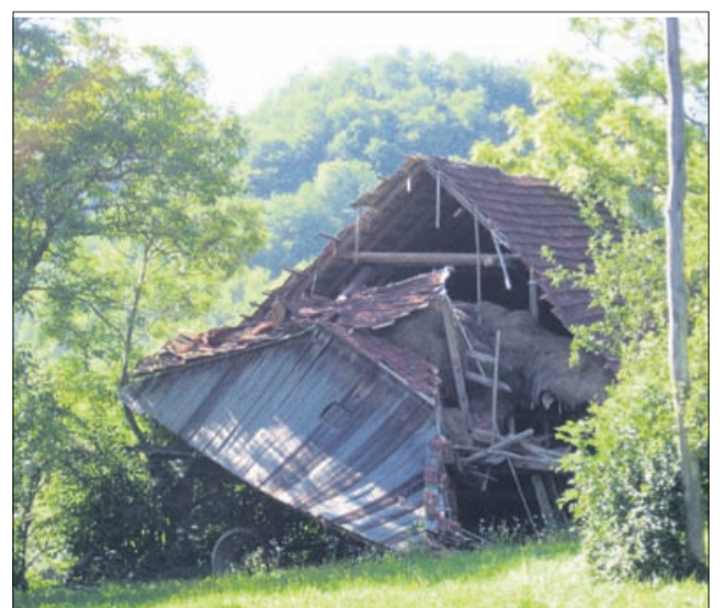
Ob glavni cesti proti Kozjemu, spet tik ob njej, je še ena razvalina. Gospodarsko poslopje, ki je pod pilštanskim trgom, se je podrlo samo od sebe.