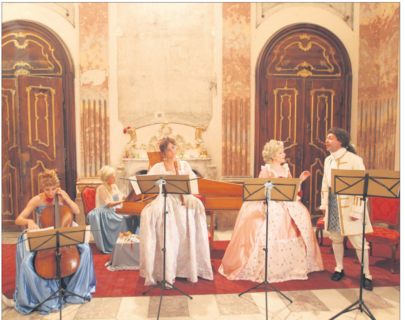
Umetniki madžarske skupine Ensemble Marquise so nastopili v rokokojskih kostumih, ki jih je za svoj ansambel, za vsakega posebej, ročno izdelal kar sopranist sam.