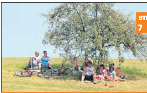
Hlajenje v pasjih dneh v našem fotoobjektivu