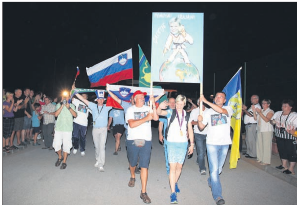
V Pernovem je bila Urškina noč. Dodatno sta jo začinila izjemna množica in ognjemet.