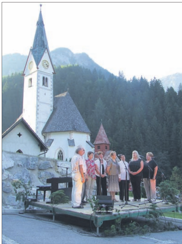
Cerkveni pevci v čast svoji zaveznici in cerkvi Marije Snežne

Nedeljski večer je bil v Solčavi znova nekaj posebnega. Ob občinskem prazniku smo bili priča doživetju prireditvi med domačimi ljudmi z lepo domačo besedo, pesmijo in poklonom farni zaveznici, Mariji Snežni. Farni praznik lepe nedelje je namreč v Solčavi tudi datum občinskega praznika.