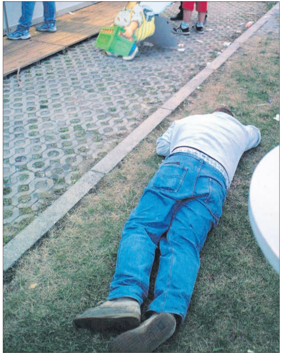
Ta prizor smo ujeli na letošnji prireditvi Pivo in cvetje. Moški je najverjetneje obležal zaradi preveč popitega alkohola in ne zaradi pretepa. Prav alkohol je sicer pogosto glavni vzrok, da na množičnih prireditvah pojejo pesti.

Pooblastila varnostnikov so širša. Varnostniki lahko, če so ogroženi življenje,