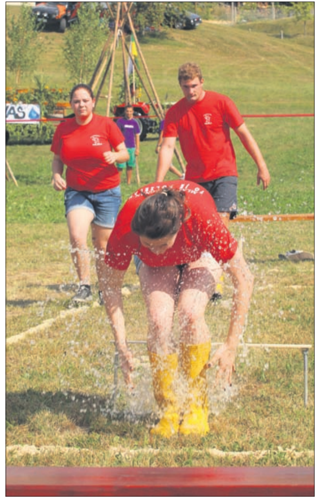
Zadnja preizkušnja pred ciljem »mokre igre« je tekmovalce dodobra osvežila.

Vsako leto si organizatorji izmislijo tudi igro presenečenja, ki je bila letos na srečo vseh tekmovalcev povezana z vodo. Po poligonu so jo prenašali v prevelikih škornjih, tik pred ciljem so morali še sonožno preskočiti oviro in nato vodo brez pomoči rok zliti v merilno posodo. Glede na to, da se je v nedeljo popoldne temperatura ozračja segrela krepko nad trideset stopinj, se tekmovalci niso posebno jezili, če so kakšen deciliter vode poškrpili po