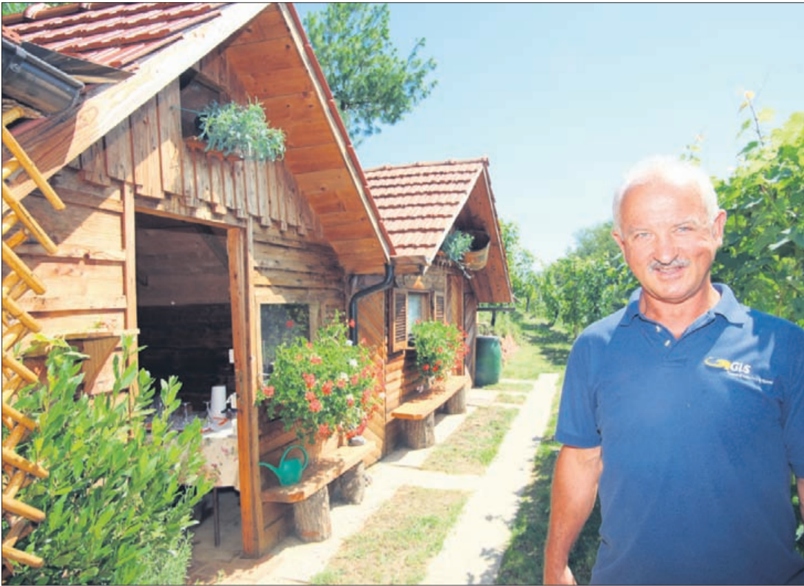
Vrata v Rafov rov se skrivajo v tej počitniški hišici. Med kopanjem prvega prostora so bila zadelana z deskami, tako da skoraj nihče ni vedel, kaj nastaja za njimi.