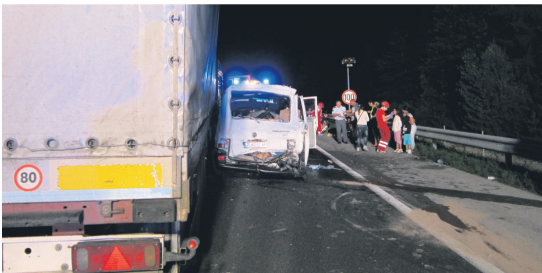
Tovorno vozilo je sredi noči trčilo v kombinirano vozilo tuje registracije.

Kot je pojasnjeno na spletnih straneh notranjega ministrstva lahko v vlogi varnostnika ukrepajo le osebe, ki so strokovno usposobljene za uporabo ukrepov varnostnika. To so varnostnik čuvaj, varnostnik, varnostnik nadzornik, varnostnik telesni stražar in varnostni menedžer. Reditelj je lahko le polnoletni državljan Republike Slovenije, ki ima ustrezne psihofizične sposobnosti za opravljanje nalog reditelja glede na vrsto shoda oziroma prireditve.