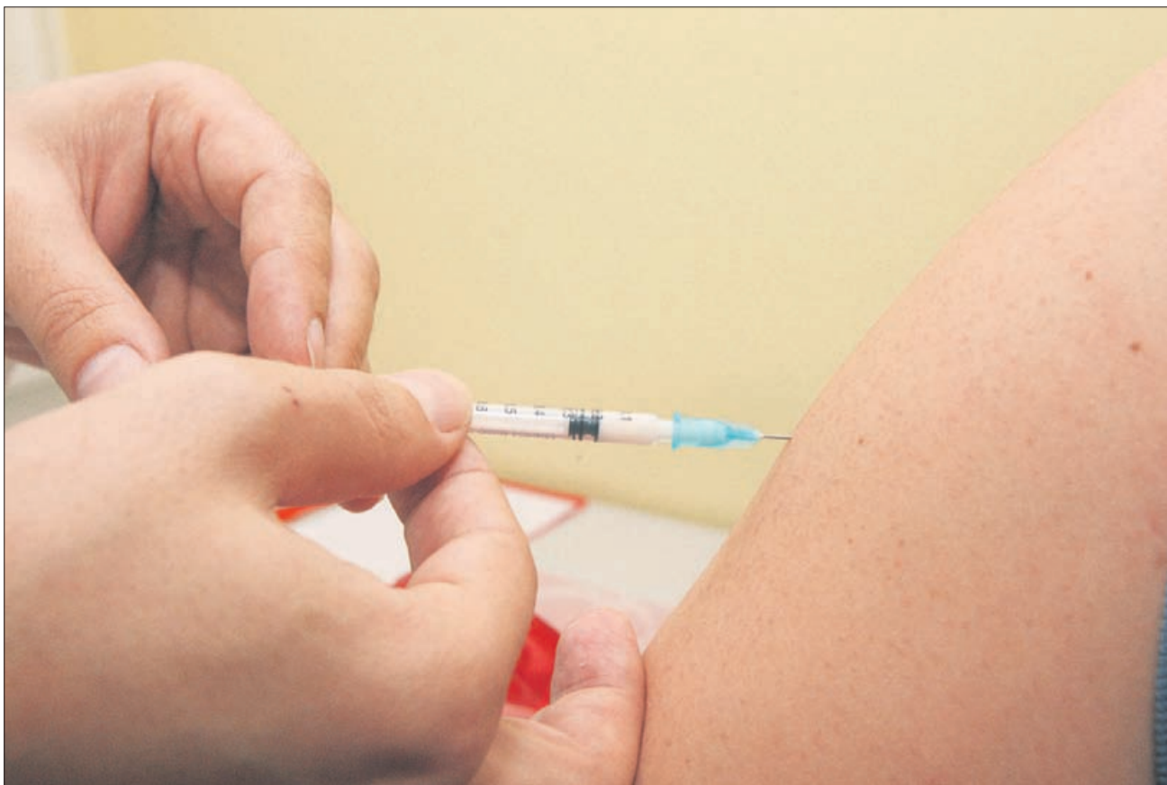
So cepljenja varna ali nevarna?