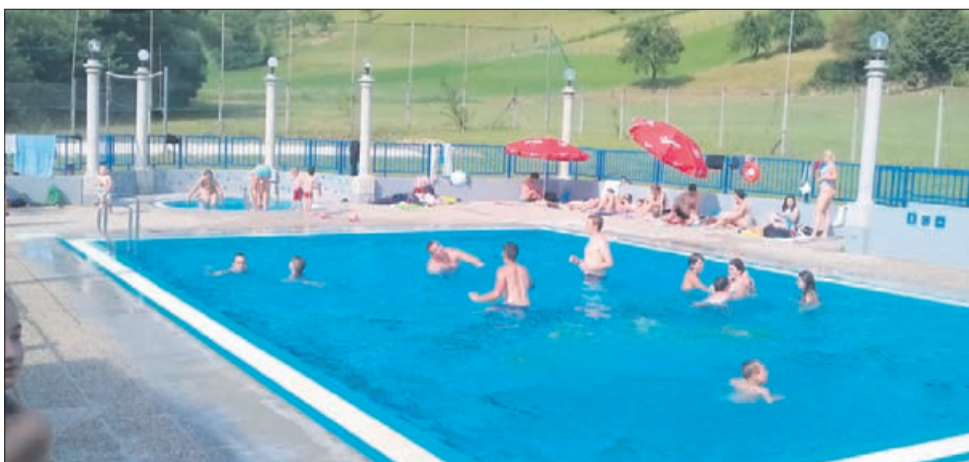
Na frankolovskem letnem kopališču pred nekaj dnevi

Občina Vojnik in Mladinsko društvo Frankolovo pripravljata na frankolovskem kopališču za otroke, starejše od 7 let, brezplačno kopanje, ki bo 9., 16., 23. in 30. avgusta (ob četrtkih). Za otroke bodo poskrbeli z brezplačnim prevozom in varstvom, avtobus bo z avtobusne postaje v Vojniku odpeljal ob 8.30, iz Nove Cerkev ob 8.50, iz Socke ob 9. uri, iz Ivence ob 9.15, iz Globoč ob 9.17 ter s frankolovske postaje ob 9.20. S Frankolovega je vrnitev predvidena ob 14.35. Informacije: tel. 780-06-40, 031/740-247, 051/633-847 ali e-pošta druzbene.dejavnosti@vojnik.si . Izpolniti je treba prijavnico.