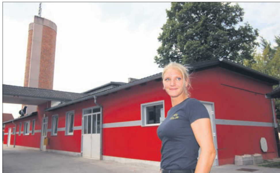
Obnova servisnih delavnic je stala okoli 40 tisoč evrov, veliko dela pa so gasilci opravili kar sami. Na polnilnico so tako posebej ponosni.