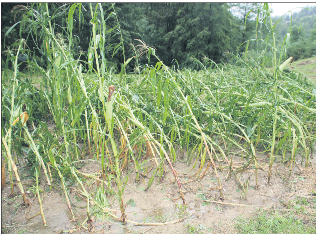
Seveda želimo, da bi bilo na Celjskem čim manj tovrstnih prizorov.

»Največ, kar lahko sami storimo, da nas ob morebitni toči ne bi preveč prizadela posledice klestenja, je prekrivanje z mrežami proti toči, ko v vrtu prekrivamo posamezne gredice ali večji del vrta, kjer rastejo občutljivejši zelenjadnici. Pri tem uporabljamo protitočne mreže različnih velikosti in gostot tkanja. Pomembna je iznajdljivost, saj za napeljavo takšnih mrež potrebujemo oporo, na katero napeljavmo takšno mrežo,« svetuje Škerbot. Če boste prekrivali cel vrt ali le del, postavite ustrezno