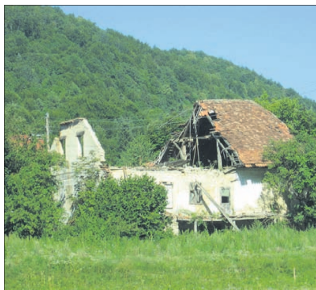
Podrtija v Šonovem, ob glavni cesti v občini Kozje, je bila nekoč mogočna stavba.