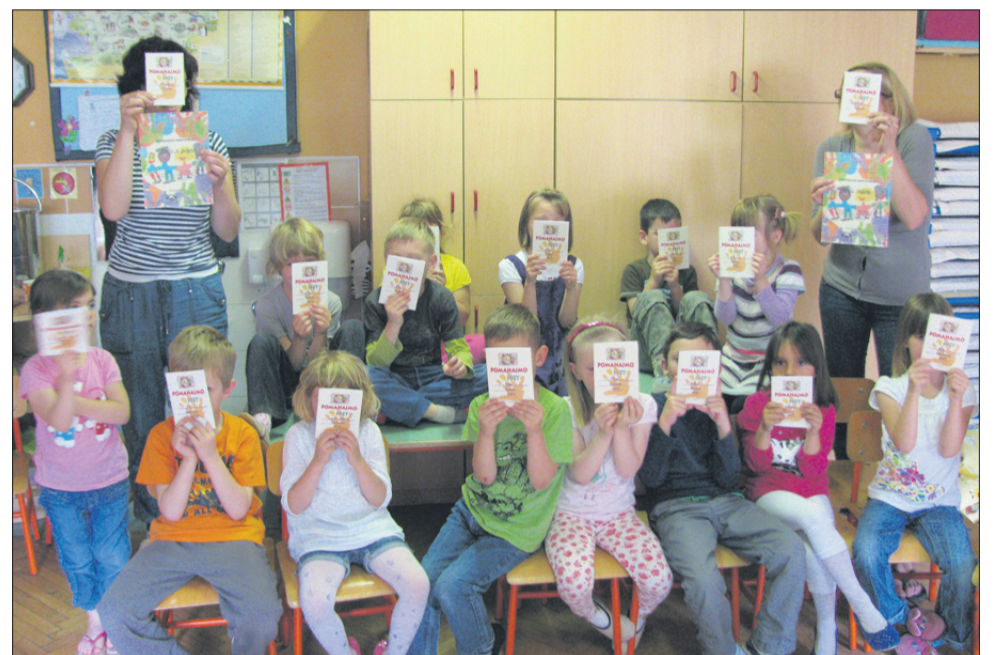
Posebni potni listi so otroke kar iz vrtca ponesli na daljno Švedsko.