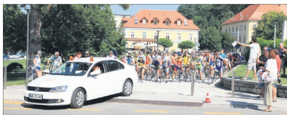
Na startu na slatinski Evropski ploščadi se je zbralo okoli 180 kolesarjev.