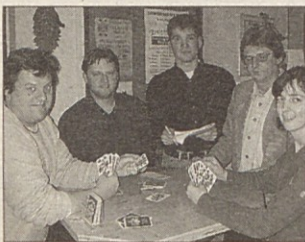
Vogrški kvartopirci se bodo pomerili to soboto pri Florijanu.

Vogrče. Tradicionalno nagradno kartanje DSG Vogrče bo to soboto, 24. marca, od 19. ure naprej pri Florijanu. Na tej tradicionalni prireditvi sodelujejo tako ženske kot moški. Ob koncu se bosta pomerila najboljša ženska in najboljši moški.