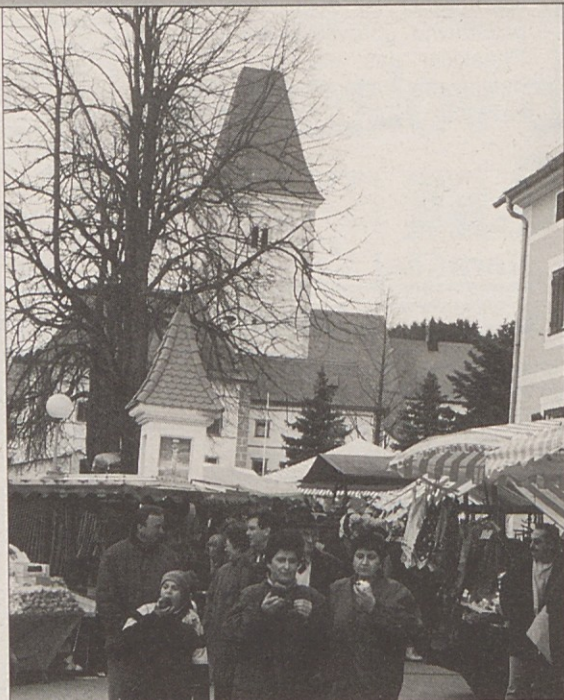
Tri dni je Dobrla vas spet v središču cele Podjune.

Dobrla vas. Letos so Dobrolčani določili Jožefov sejem za 23., 24. in 25. marec. V petek popoldne bo ob 17. uri srečanje vseh Jozejev, Pepc in Pepejev. Vsak, ki mu je tako ime in to lahko dokaže, bo dobil od Rutarjevih 6 steklenic piva in bon za nakup v centru. Povsod po Dobrli vasi so letos tudi večji šotori z glasbo v živo. V soboto in nedeljo pounujajo novo atrakcijo, namreč polete s helikopterjem nad Dobrlo vasjo.