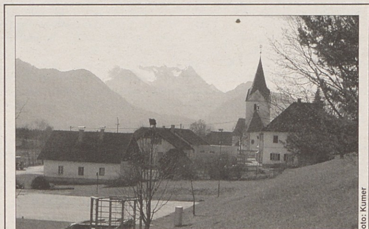
Pri župnišču (desno) bodo zidali nov bilčovski gasilski dom.