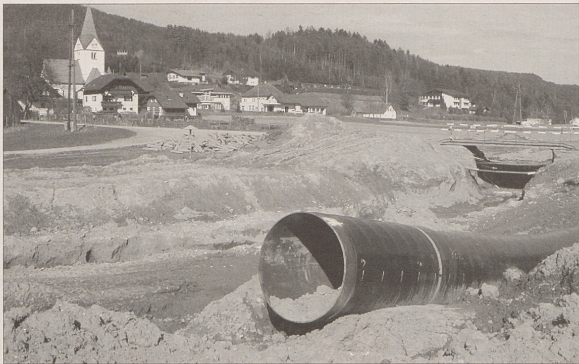
„Adria-Wien-Pipeline“ je že mesece v občini Bilčovs, kjer imajo občani počasi že dovolj, polja so razorana, ceste umazane, kmalu pa bodo prišli že prvi turisti.

Zahteve: znanje tujih jezikov (slovenščina in angleščina v pisni in ustni obliki), dobro računalniško znanje, opravljena vojaška služba Prošnje naslovite na: "Filli"-Stahlgroßhandels.gmbH., Schrödingerstraße 5, 9020 Klagenfurt-Celovec, tel. 0463/37970-3951 (g. Jernej)