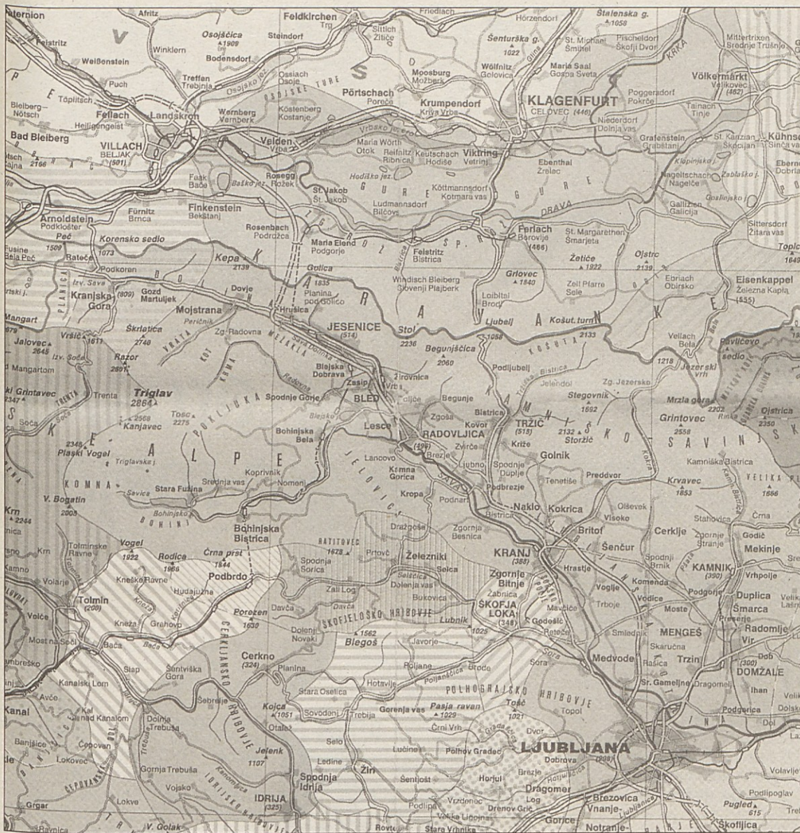
Dialektološka karta „Geodetskega zavoda Slovenije“, pri kateri gre za prikaz slovenskih narečij.