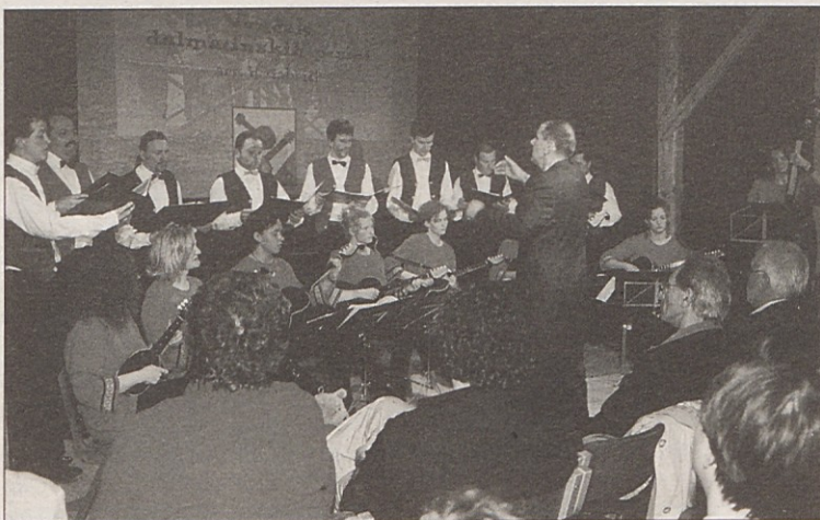
Tamburašnje in pevci so navdušili z venčkom dalmatinskih in koroških narodnih pesmi.