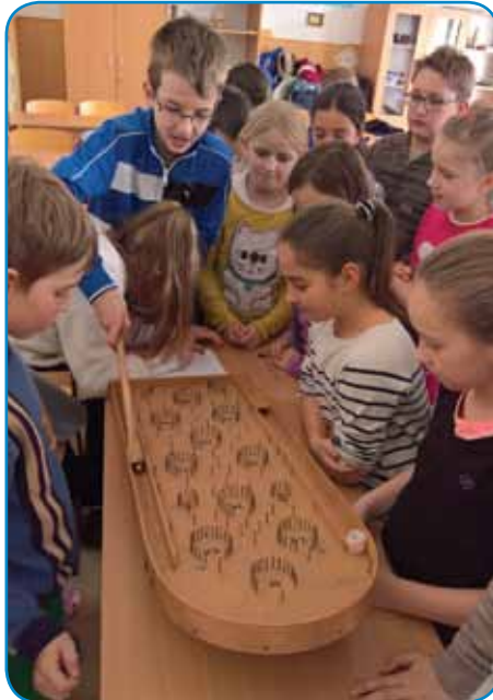
Igra Marjanca na gornjeseniški šoli

so igrali »marjanca«, izdelovali »brkvence« in iz »stučkov« zidali stolpe. Učenci so pri igranju zelo uživali in