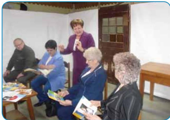
Gledališka družina Nindrik-indrik

Gledališniki Nindrik-indrik smo na pozvanje Humoristične skupine Nemaki v vesi Selo letos 10. februara pá leko gora staučili na 4. Veselom večeri v Vaško-gasilskom daumi. Prvo paut so meli v plani 13. januara, gda so v zadnjom minuti mogli vse dola