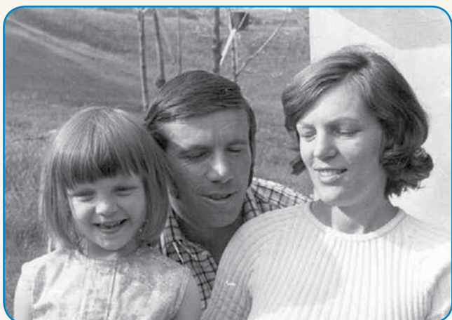
Dela tam, gé ji je fajn stran 5