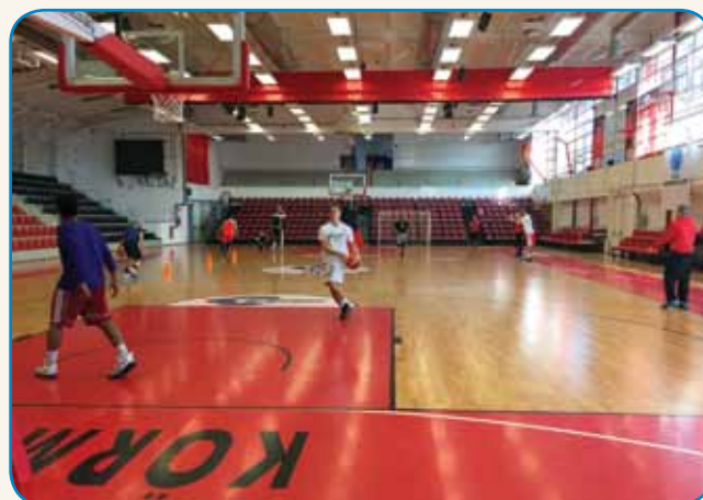
Dati vse od sebe na treningih in tekmah stran 10