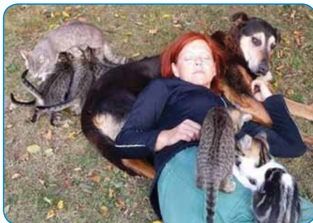
Rada ma naravo in živali

neškejo zdraviti samo ob pomauči padarov, iščejo še drüge metode. Eni neškejo več mesa gesti, bole vegetarijansko in vegansko.« Sploj so v radenskom dau-mi znani po tom, ka probajo spunjavati želje njihovih stanovalcov, »vej pa ške-mo, ka ohranijo svoje navade. Če sto ške spati do devete, ga pistimo, de pač meu zajtrk malo kesnej. Spoštüvlemo