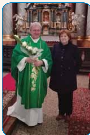
Škofovskemu vikarju ... stran 4