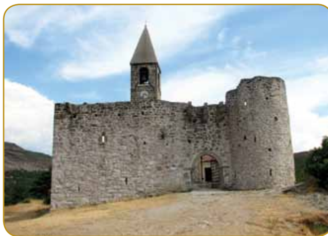
Prausno lüstvo se je v nevarnosti potegnülo v »tabore« - eden najbole erični je v primorski Hrastovljaj

Törki pa so nej sami od sebé odišli. Gda je Maksimilijan I. Habsburški cesarstvo prejkvzeu, je obramba bole krepka gratala. Svoje dežele v gnešnjoj Avstriji je raztalo na gorenje- ino spaudnjeavstrijske, v nji pa stvauro državne kancelaje, ranč kak v Beči: za finance, za birovijske pa za politiko. Dežele Štajersko, Koroško ino Kranjsko (kisnej pa eške Goriško) je povezo