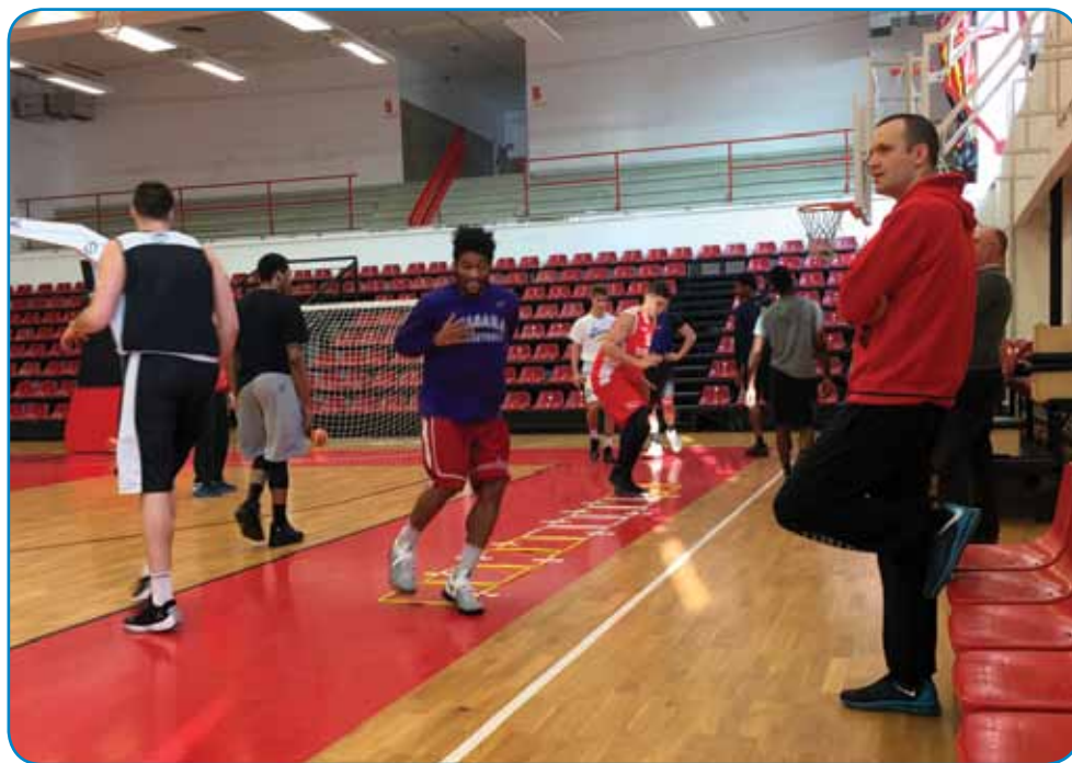
Slovenski trener se s svojimi igralci pripravlja na tekme dvakrat na dan