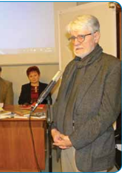
je dolžna skrbeti za Slovence v sosednjih vah.«

vi. Največ Slovencev živi na porabskem podeželju, pa v Monoštru, Sombotelu, Budimpešti, Moson-