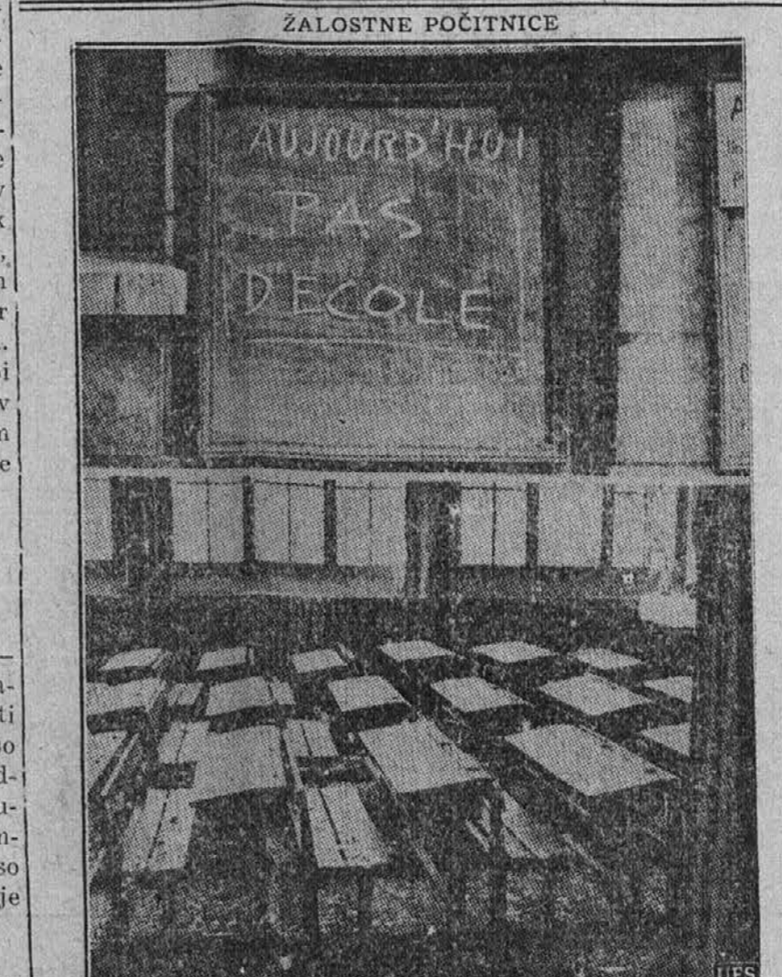
Šolske klopi v francoskem mestu Nancy stoje prazne. Šolski pouk je bil namreč ukinit zaradi nemških zračnih napadov. Napis na tabli pravi: "Danes ni šole." Kakor se lahko vidi, so klopi in tla pokrita z odpadki ometa in prahu.

Kairo, Egipt. — Pridigarji po mohamedanskih mošejah širom celega Egipta so zadnji petek pričeli s propagando med svojimi verniki, naj se pripravijo na "johad," namreč na sveto vojno na strani zaveznic. Egipt, kakor znano, ima vojaško zvezo z Anglijo; po drugih mohamedanskih deželah se ni gotovo, ali se bo prebivalstvo klicu odzvalo. Značilno je, da je bilo koncem tedna odložen za daljši čas odod treh italijanskih parnikov, ki bi imeli tekom tega tedna odpluti proti Ameriki.