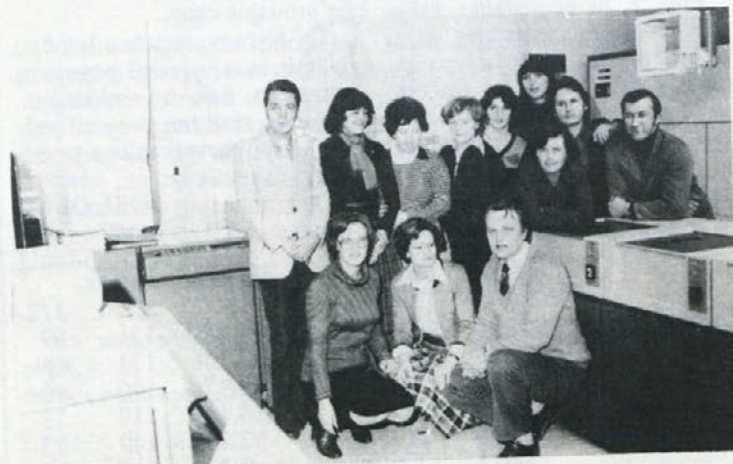
Novembra je minilo pet let, odkar je pričel obratovati naš računalniški center. V tem času je skupini na posnetku, a tudi tistim, ki jih slučajno ni na sliki, uspelo obvladati kar precej zahtevne operacije. Ob jubileju, ki so ga proslavili le s poziranjem pred kamero, jim iskreno čestitamo.