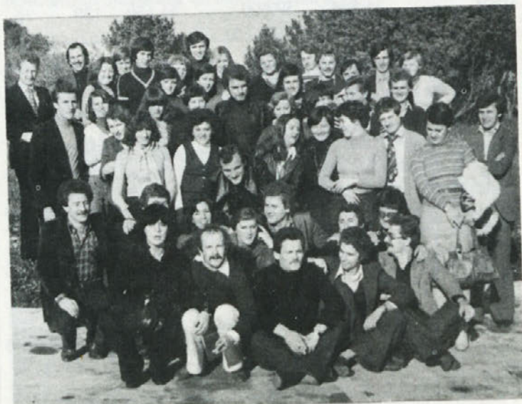
USPEL SEMINAR – Izobraževalnega seminarja za predsednike osnovnih organizacij Zveze socialistične mladine Slovenije iz delovnih organizacij, ki je bil konec minulega meseca v Poreču, se je udeležil tudi predstavnik iz mirnopske Beti. Seminar je pripravila novomeška občinska konferenca ZSMS, udeleženci pa so ob koncu izjavili, da jim je taka oblika izobraževanja všeč.