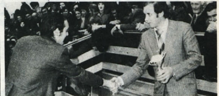
Na letošnjih delavskih športnih igrah so ženske in moške ekipe delovne organizacije Beti osvojile prvo mesto in so prejele za to prehodna pokala. Vse kaže, da šport v naši delovni organizaciji ne ni tako na psu, malo več organiziranosti pa gotovo ne bi škodilo.