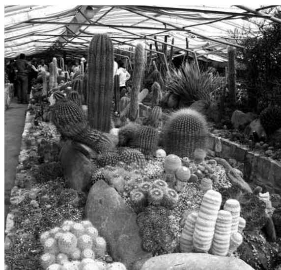
Mala Mehika kaktusov