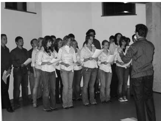
Mladinski pevski zbor iz Ponikev