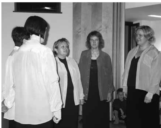
Vokalna skupina Mavrica