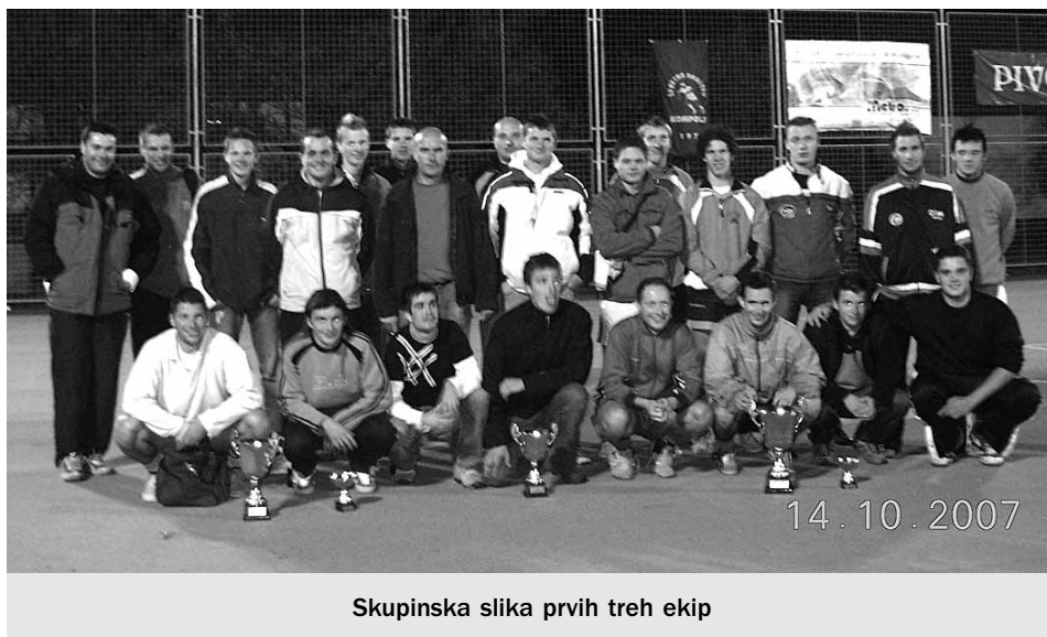
Skupinska slika prvih treh ekip

Upamo, da je ta turnir vzpodbudil željo po športu tudi v bolj neprijaznih vremenskih okoliščinah in pokazal, da lahko uspe če je volja in želja dovolj velika.