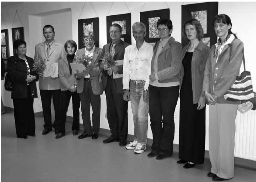
Spominska fotografija z avtorjem razstave

Metka Starič , Zavod Parnas