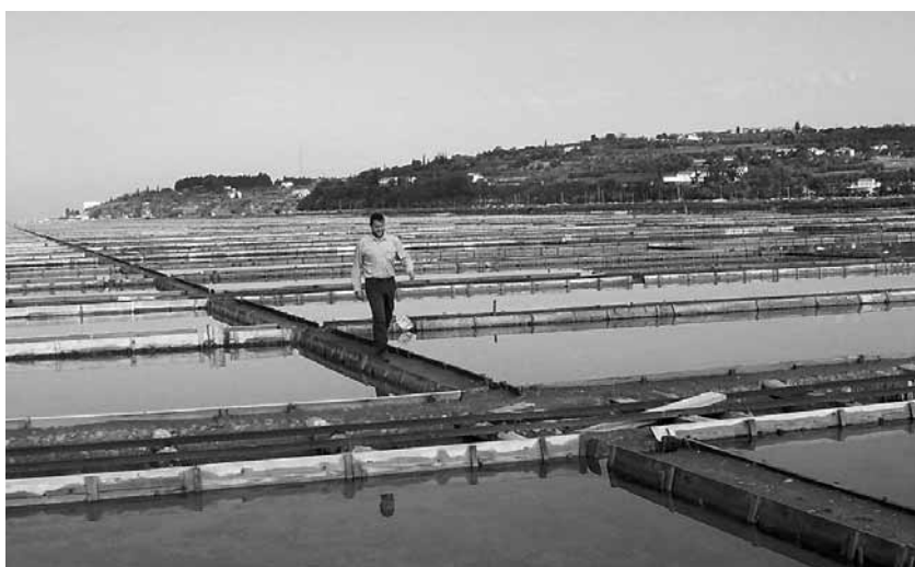
Frenk na prepovedanem območju solin