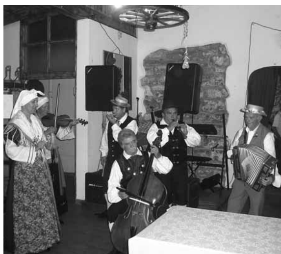
Šavrinski godci (sliki zgoraj in spodaj)