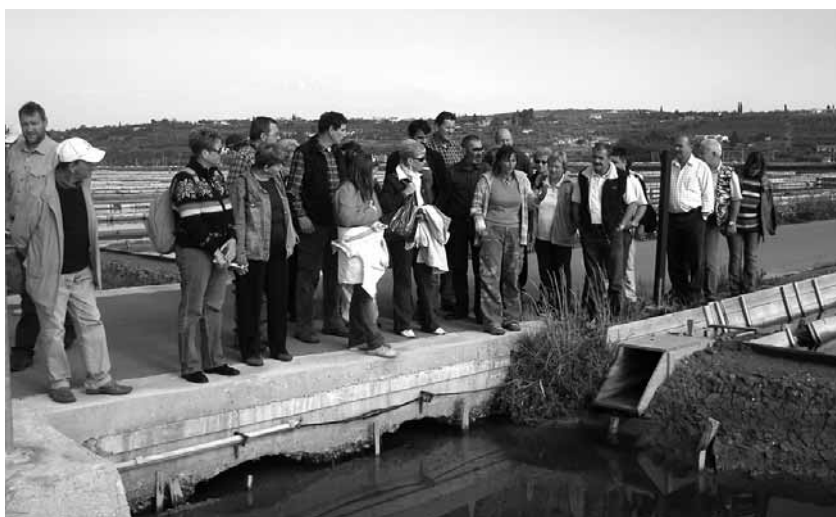
Vodič o solinah