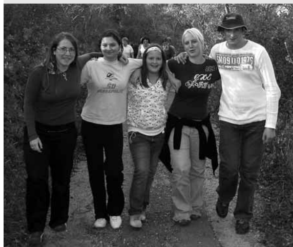
Mladi s pesmijo po učni poti