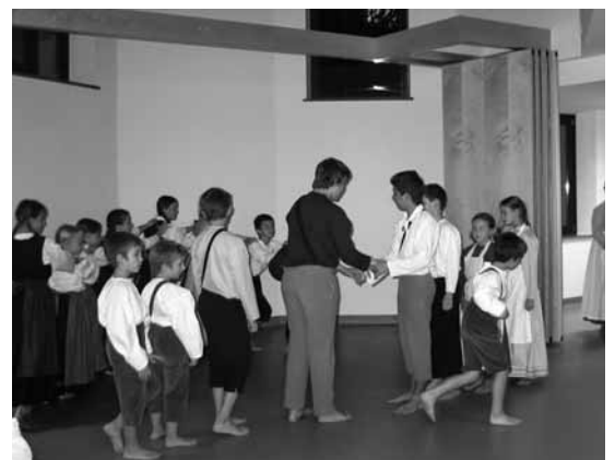
Folklorna skupina OŠ Ponikve

Avtor fotografij je Franc Brezovar, nastale pa so iz ljubezni do drobnih lepot, ki jih glede na to, da živi tik ob mokrišču, lahko opazuje v njihovem spreminjanju dan za dnem. Razstava je bila prvič na ogled ob svetovnem dnevu mokrišč v galeriji Skedenj na Trubarjevi domačiji v letu 2005, svoje potovanje sedaj počasi zaključuje. Avtor razstave meni, da si v obdobju digi-