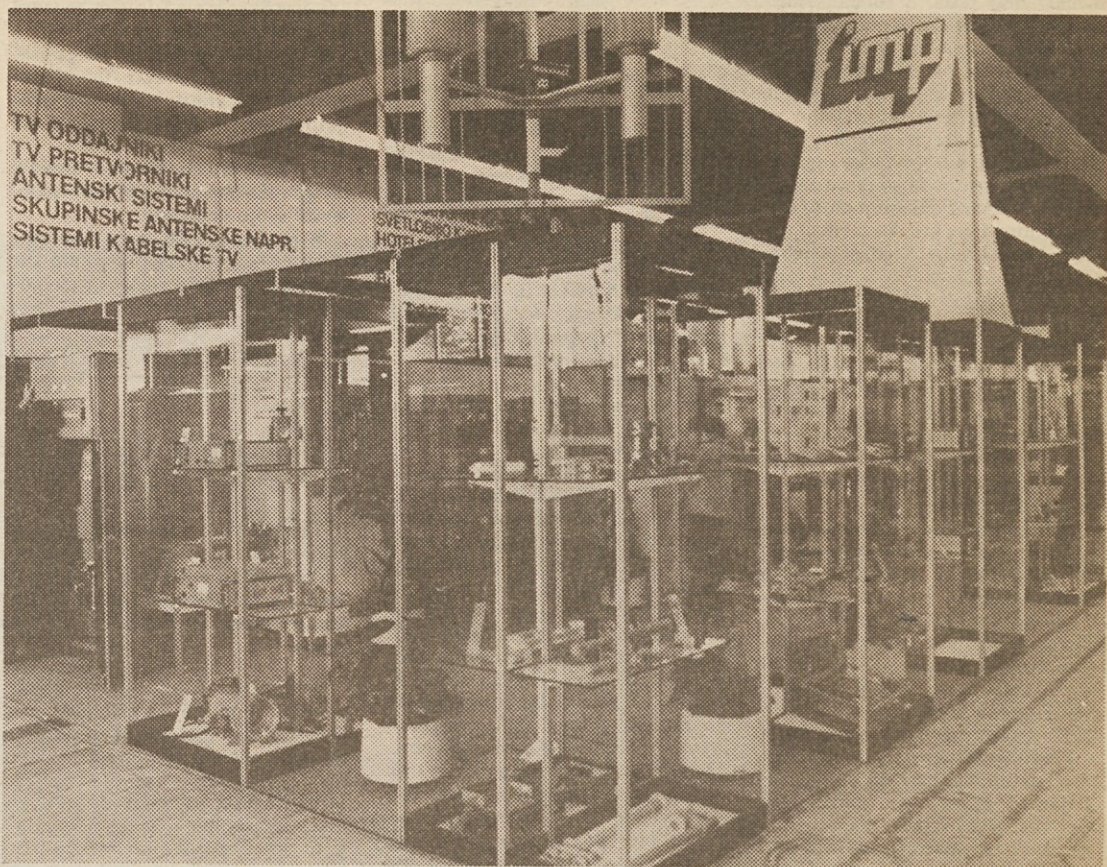
IMP-jev razstavljeni prostor na sejmu Sodobna elektronika, ki je bil na Gospodarskem razstavišču v Ljubljani.