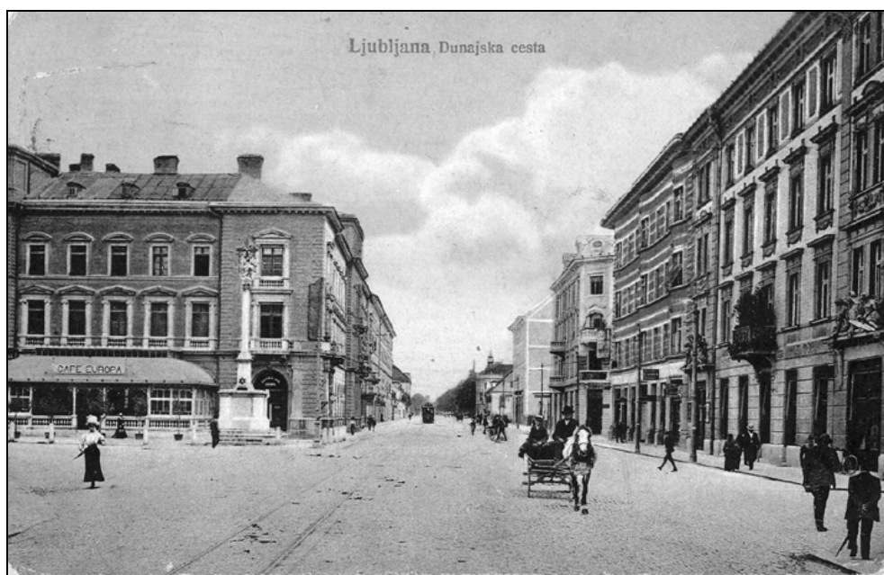
Pogled na hotel Evropa, kjer je bilo v začetku uredništvo Slovenskega naroda. Na desni hiša Ivana Hribarja z razgibanim pročeljem, zgrajena v letu 1903 (SI ZAL, LJU 342, Fototeka, a. e. G2-020-015).