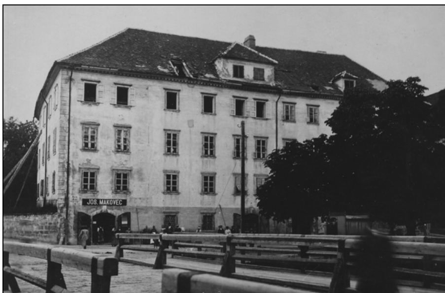
S tramovi podprta Zoisova hiša na Bregu po potresu, kjer je imela višja deklinška šola prostore v prvem šolskem letu 1896/1897 (SI ZAL, LJU 342, Fototeka, a. e. A1-201).