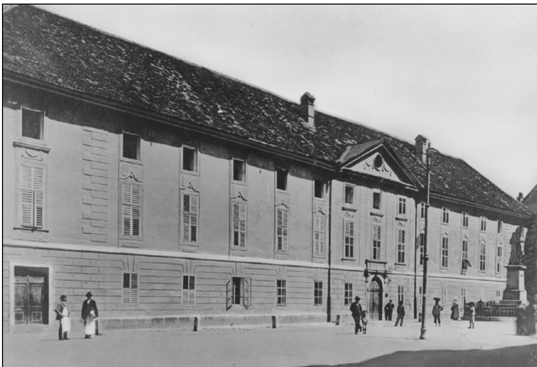
Poslopje stare gimnazije in liceja pred potresom, vendar že po postavitvi Vodnikovega spomenika, med letoma 1889 in 1896 (SI ZAL, LJU 342, Fototeka, a. e. A1–407).

Ivan Hribar je na seji ljubljanskega mestnega sveta 31. maja 1882, katere zapisnik je bil prvič napisan v slovenščini, predlagal prošnjo na državni zbor, da se uvede slovenski jezik v srednje šole. 12 Kljub temu je tako stanje z nekaj manjšimi izboljšavami na nižji stopnji gimnazije trajalo več ali manj do leta 1908, ko se je le začelo uvajanje slovenščine kot učnega jezika tudi v višjih razredih gimnazij. 13