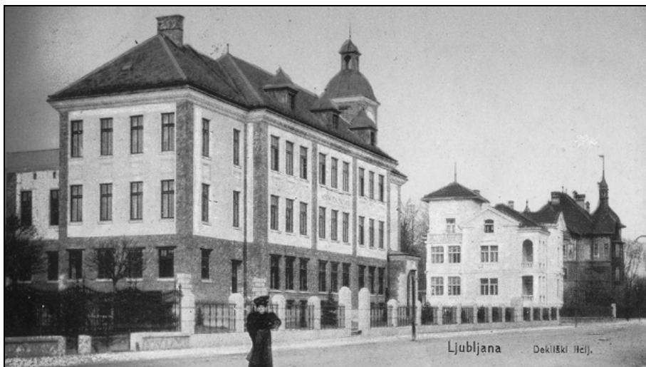
Dve podobi dekliškega liceja Mladika, v katerem je bila še v šolskem letu 1910/11 tudi višja dekliška šola (SI ZAL, LJU 342, Fototeka, a. e. G4-039-002 in A01-035).

tem ustreglo želji naroda slovenskega. Redni pouk na njej pričel se je že v popolno zadovoljstvo'. Župan je še povedal, da je bil na obisku pri naučnem ministru baronu Gauschu, ki je obljubil od leta 1898 stalno državno podporo temu zavodu. Oznanil je tudi ministrovo željo, da bi se učenke čim bolj naučile nemščine, zato je kuratorij to željo upošteval in tako se pouk zgodovine izvaja v nemščini. 107