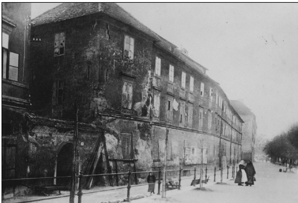
Stavba stare gimnazije in liceja, poškodovana v velikem ljubljanskem potresu v letu 1895. V letu 1903 so jo podrli, na njenem mestu stoji ljubljanski živilski trg.

narjev), njegov bratranec Franc Kalister iz Trsta (2.500 goldinarjev) in hrvaški škof Strossmayer (600 goldinarjev). 36 Hribar je v letu 1888 tudi priporočil Gorupu nakup posestva deželne bolnišnice v Ljubljani. 37