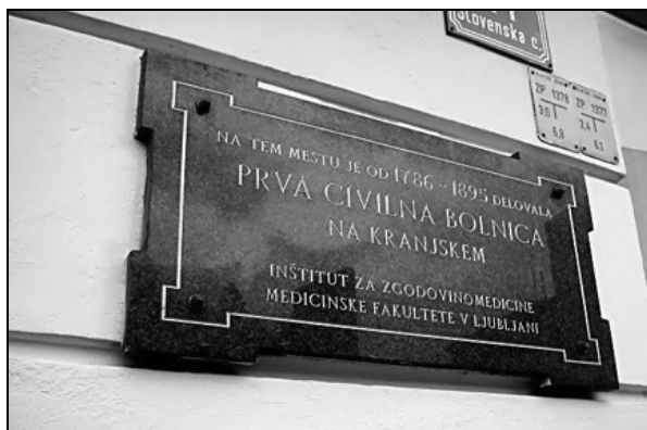
Spominska tabla na Ajdovščini obeležuje kraj, kjer je v letih od 1786 do 1895 stala stara deželna bolnišnica.

Če se vrnemo nazaj v leto 1888, leto nakupa stare bolnišnice in na Gorupovo obljubo, da bo stavbo podaril ali deželi ali mestni občini, ugotovimo, da s tem zadeva še zdaleč ni bila urejena. Mestna občina se vse do leta 1894 ni mogla odločiti, ali bo podarjeno poslopje stare bolnišnice res preuredila v višjo deklinško šolo. Povod za to, da so se mestni veljaki zganili, je bila bližajoča se petdeseta obletnica vladanja cesarja Franca Jožefa I., ki so jo sklenili obeležiti z ustanovitvijo višje deklinške šole, 'ki bode še v poznih letih pričala o lojalnosti mesta ljubljanskega'. Na seji mestnega sveta 26. oktobra 1894 so pametno ugotovili, da morajo slovenski starši pošiljati deklice, ki želijo višjo izobrazbo, v 'tuje zavode' s tujim učnim jezikom, na Kranjskem pa obstaja že nekaj let ustanova mecena Josipa Gorupa, ki je naložil 50.000 gol-