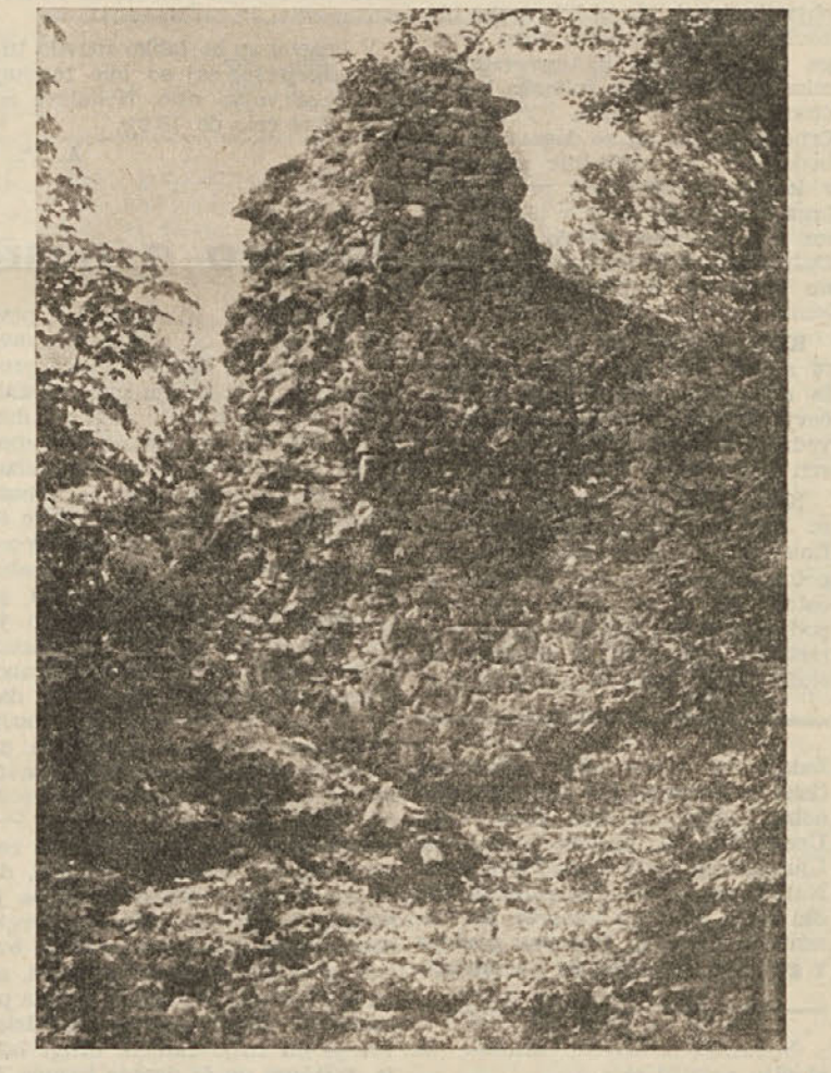
Razvaline gradu Fridrihštajn nad Kočevjem