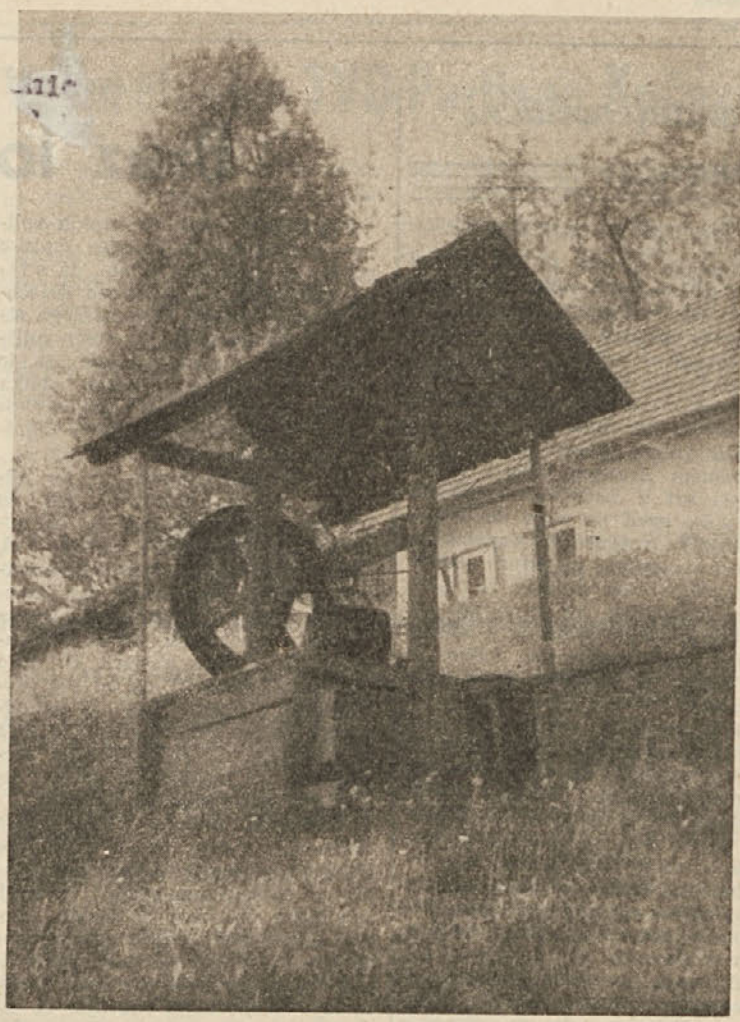
Posebnost vasi v Slemenih so tudi takile vodnjaki

Tretji mednarodni vinski sejem je zaključen. Na tem sejnu je bilo prodanih 748 vagonov vina za približno poldrugo milijardo din. Vino je bilo prodano predvsem za izvoz. Od jugoslovanskih razstavljavcev so sklenili največje kupčije Slovenija-vino iz Ljubljane, »Navip« iz Beograda, »Vinag« iz Ljubljane, »Istra-vino« z Reke, »Vino« Koper, »Loza« iz Skoplja, Vinarska zadruga Maribor itd. Jugoslovanska vina so na tem sejnu dobila mednarodna priznanja.