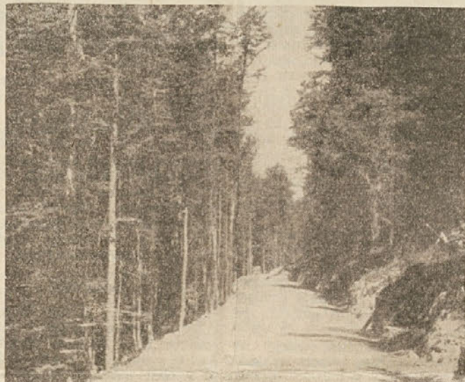
Za ureditev gozdnih cest so bila vložena velika denarna sredstva