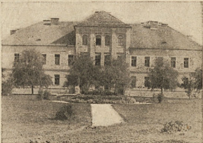
Osnovna šola v Kočevju

Volivci, prepričajte se, ali ste vpisani v volilni imenik!