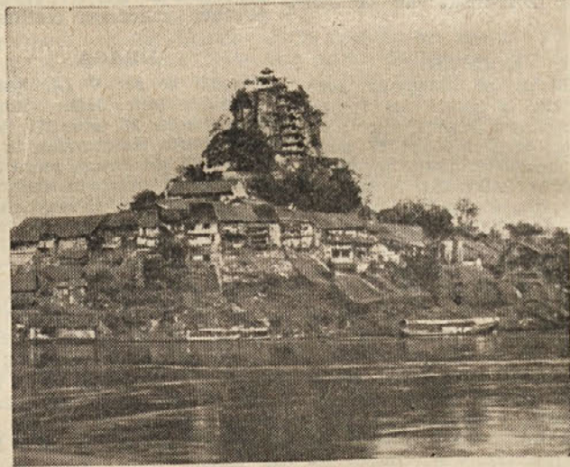
Sveta skala s svetiščem in vasjo ob reki Jancengjang

na Hrvaškem, vsa kočevska stran in celo Triglavsko pogorje. Turisti, ki prihajajo v Poljansko dolino, radi obiskujejo hrib Kozice. Tudi podzemeljsko jamo v Grajščici večkrat obiščejo turisti. Predgrad je v središču Poljanske doline, zato je tu vedno živahen promet. V Predgradu se cepita tudi dve cesti.