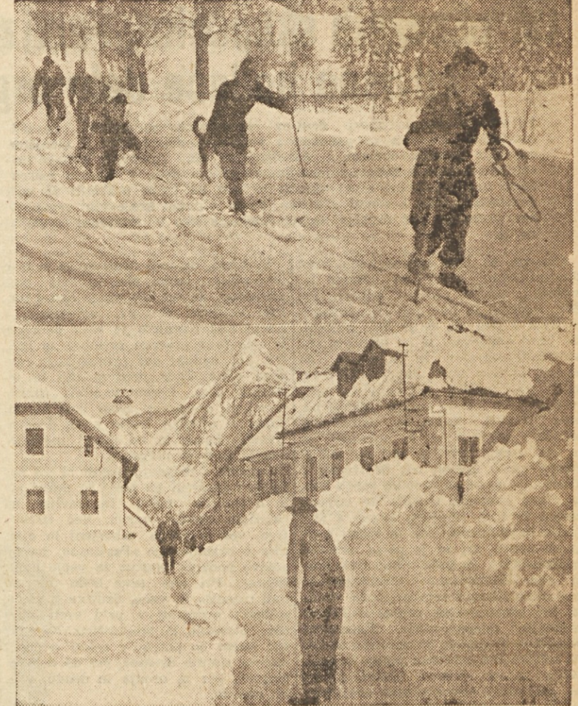
Dva prizora iz Slovenske Primorske. Zgoraj peljejo vasčani prve ponesrečence do najbližjega kraja, kjer bodo dobili zdravniško pomoč, spodaj pa vidimo, da je sneg zastul poslopja do drugega nadstropja (okna prvega nadstropja so skrita po snegu)

V ponedeljek so bile odigrane zadnje tri hokejske tekme na letošnji zimski olimpiadi. Najprej je Poljska premagala Norveško, nato pa je sledila odločilna tekma med Češkoslovaško in Švedsko, ki naj bi prinesla enemu izmed obeh tekmecev z enakim številom točk tretje mesto in z njim bronasto kolajno v hokejskih tekmah na olimpiadi ter obenem evropsko prvenstvo. Čeprav je Češkoslovaška vodila že 3:0, so vendarle Švedci z odlično igro v zadnji tretjini dosegli zmago in s tem se v lestvici uvrstili pred Češkoslovaško, čeprav ima le-ta boljše razliko v golih. Konč-