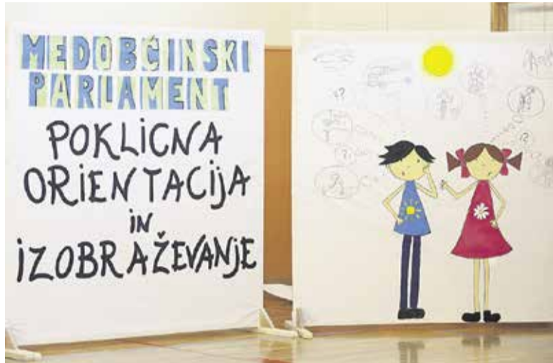
Teme otroških parlamentov so zelo različne.

nje prihodnosti. Gostiteljica letošnjega otroškega parlamenta v organizaciji Zveze prijateljev mladine Domžale bo 3. februarja 2017 Osnovna šola Mengeš. Temo so osnovnošolci izbrali lani, spomnimo, da so tedaj obravnavali temo Pasti mladostništva, na državnem otroškem parlamentu, ki že vsa leta predstavlja obliko sodelovanja otrok v družbenem dogajanju ter pridobivanje vedenj o človekovih in državljskih pravicah ter je po-