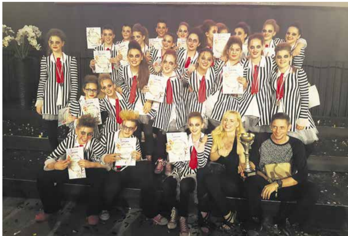
Mladinska street dance formacija

Izjemno ponosni smo na vse dosežke, ki so si jih letos s trdim delom priplesali naši plesalci. Čestitamo jim za vse uspehe in tako njim kot tudi trenerjem želimo, da bi bilo tudi leto 2017 tako uspešno, kot je bilo lansko. Ravno ko so tekmovalci zaključili sezono, so rekreativni plesalci Plesne šole Miki že pokazali, kaj vse so se naučili do januarja. Vrtčevski plesal-