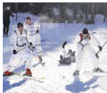
Ekipa z nosili UT 2000 pri transportu sotekmovalke v cilj.

Na tem tekmovanju smo nastopili že lani in presenetili s prvim mestom v kategoriji enot CZ ženske. Enako je bilo tudi letos. Ekipa je