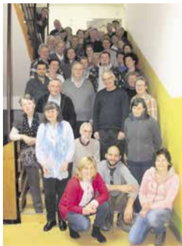
Udeleženci seminarja na OŠ Dob