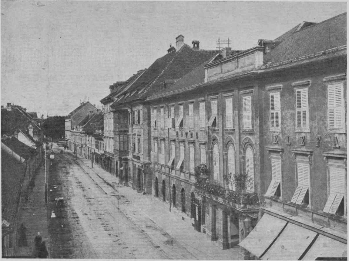
Dunajska cesta (sedaj Titova cesta) od hotela Slon (desno) proti severu; nizka hišica nasproti hotela je bila vojaško skladišče