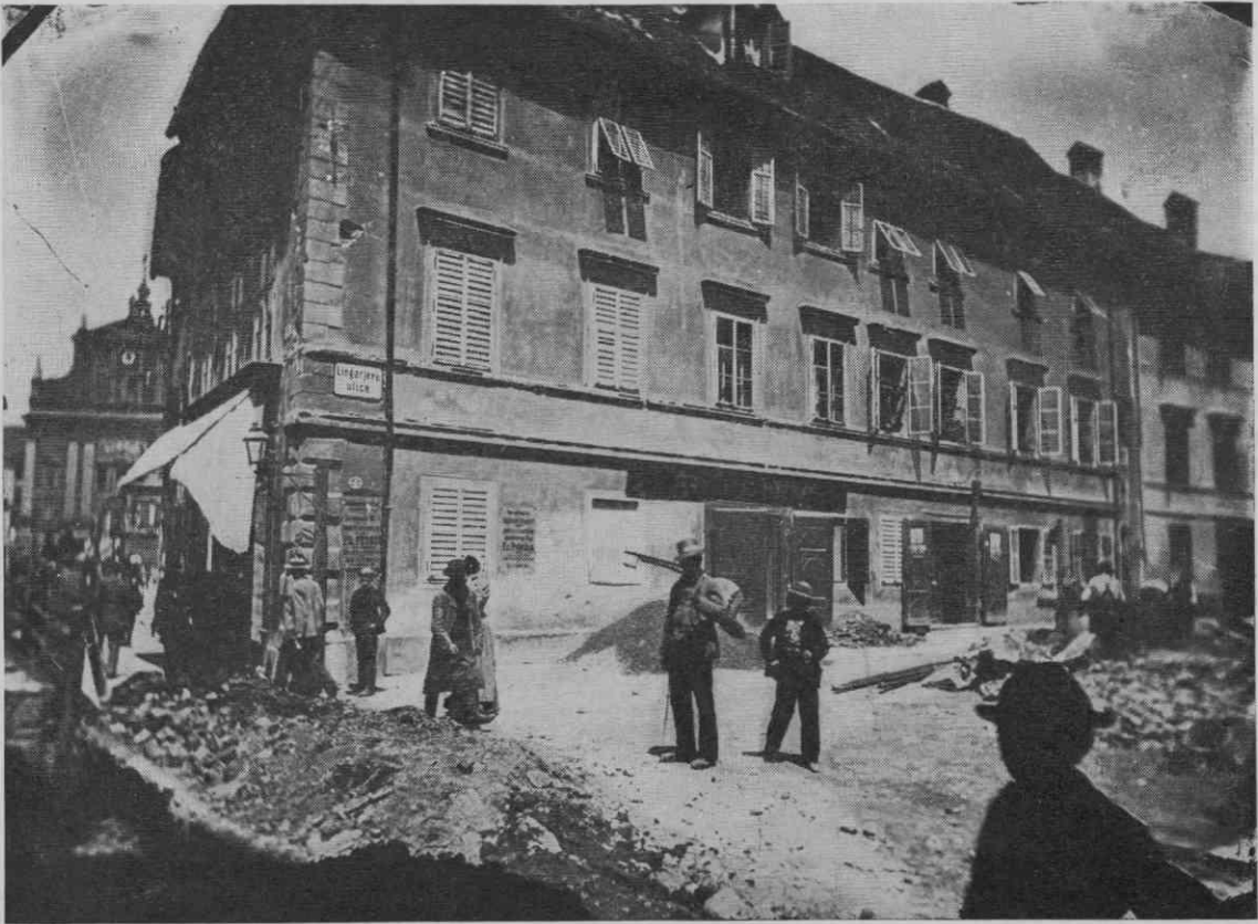
Lingarjeva ulica, sedaj Mačkova ulica, ob potresu leta 1895