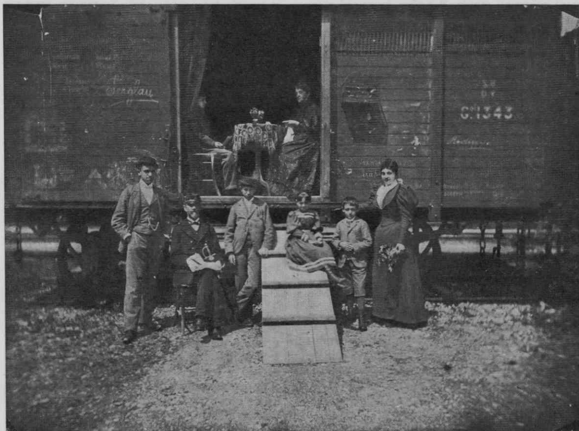
Zasilna stanovanja v vagonih po potresu leta 1895