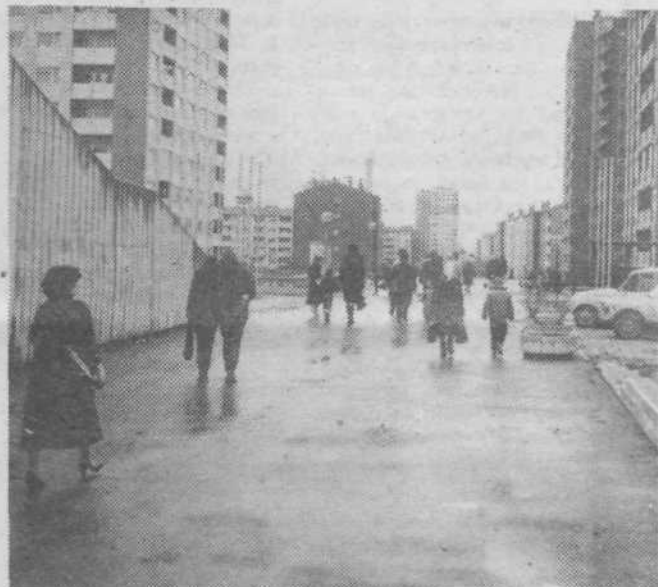
Podhod pod Litjsko cesto je zaživel, saj je samo to možno varno priti na drugo stran ceste. Napoved, da bo to eden najbolj frekventiranih podhodov v Ljubljani, se že uresničuje.