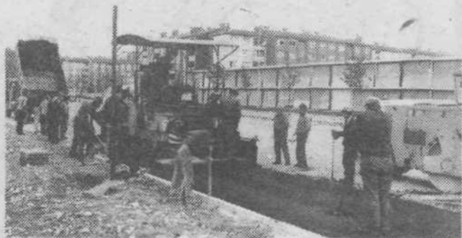
Asfalt na končni postaji mestnega prometa za progi št. 5 in 9. Upajmo, da bo do konca tega meseca urejeno tudi vse drugo in bo avtobus zapelj do tu.