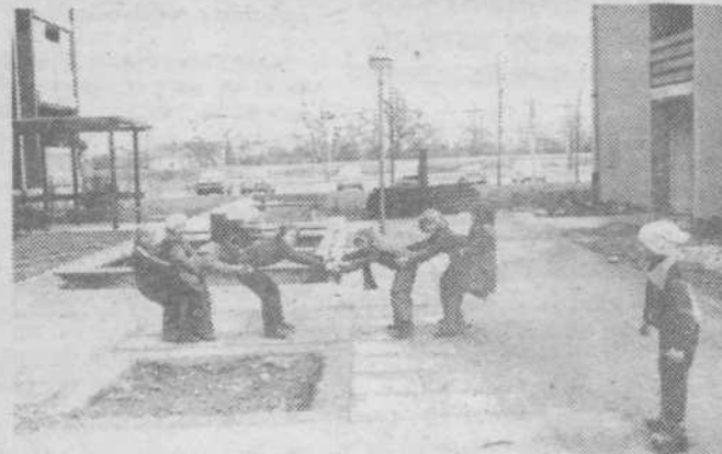
»Ali je kaj trden most?«