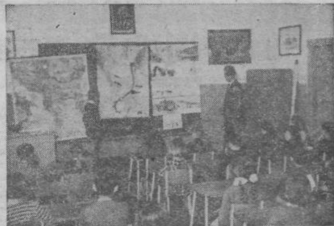
Pouk v šoli »Vojislav Ilić« v Beogradu

Nekatere izmed teh komisij so dosegle pomembne rezultate. Po zaslugi komisij za kulturno-zabavno življenje dijakov imajo številne šole svoje umetniške sekcije ali skupine, ki organizirajo zelo uspele prireditve. Z njihovo pomočjo organizirajo kinematografske predstave, razna pojedna predavanja in izlete, ustanovili so sekcije ali društva raznih fizikulturnih organizacij, kakor so skupine izvidnikov, strelske družine, klubi Ljudske tehnike, organizacije »Partizana« itd. Njč manj uspešno ni tudi bilo delo drugih komisij.