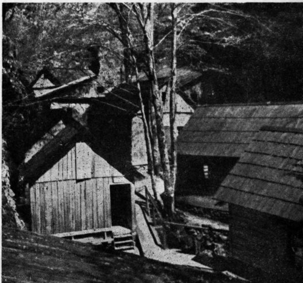
»Franja« je bila letos temeljito obnovljena