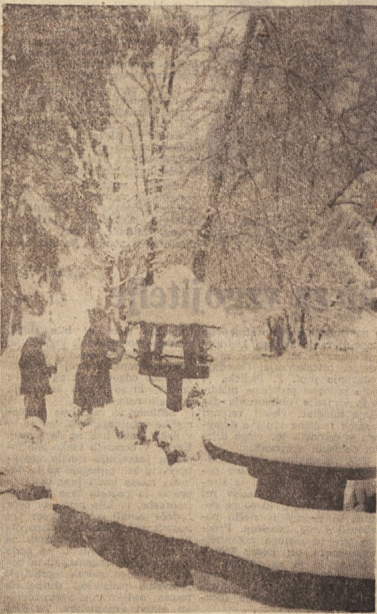
Letošnjo zimo ga je pa nasulo, pritisnil je mraz in uboge živalce — so se otroci povsod tako spomnili nanje, kot na tej sliki?

angažiranje celega človeka, premišljeno ustvarjanje čim bolj konstruktivnih vzgojnih situacij in dviganje reakcij vzgojitelja na akcije otrok na višji nivo konstruktivnih pedagoških sintez. Učinkovita vzgoja ne preneša šabloniziranja in improviziranja ter predpostavlja temeljito (Nadaljevanje na 2. strani)