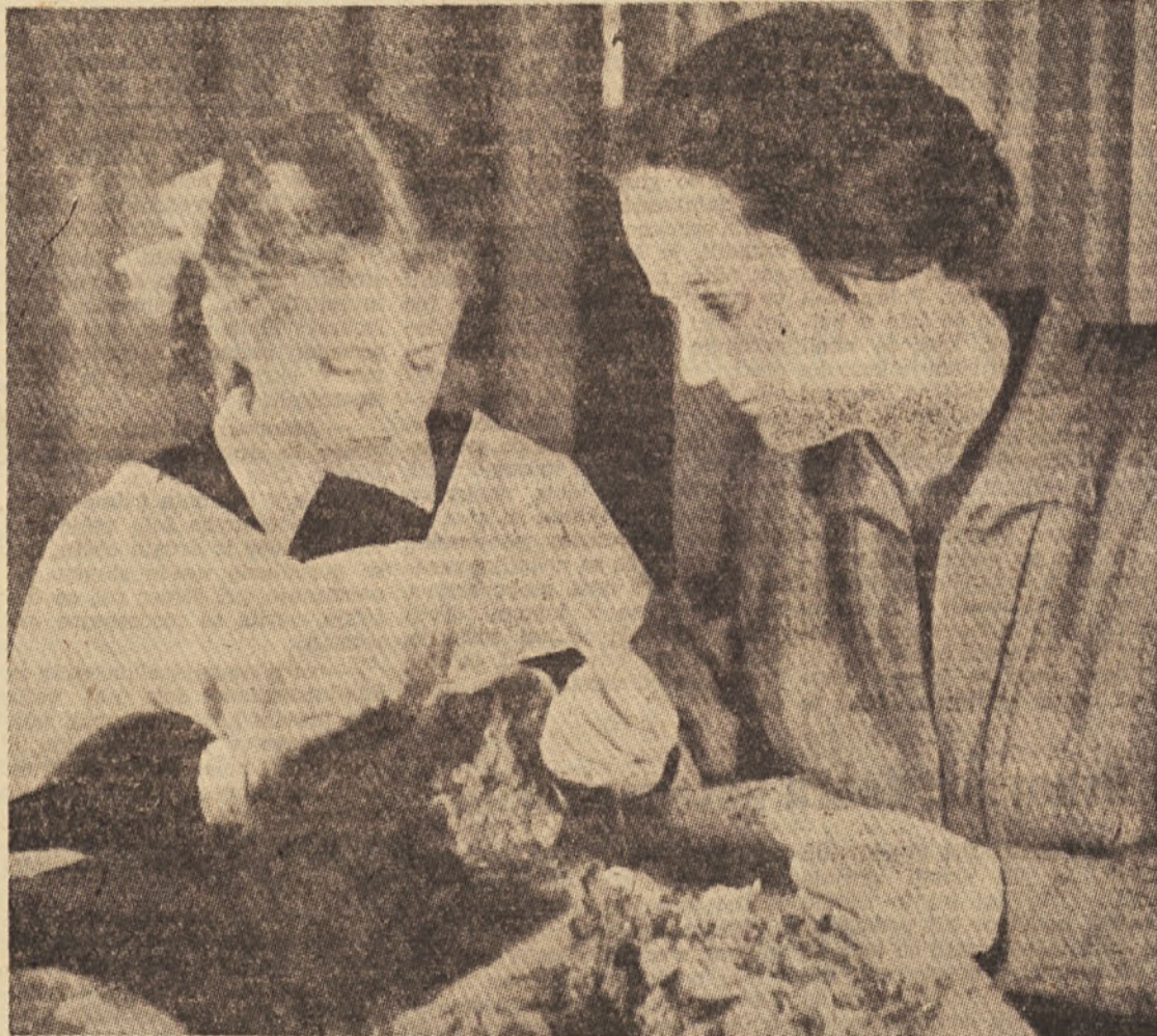
Mlada Ukrajinka se uči vesti. (S stalne pedagoške razstave v Zenevi)

Na tem področju še nimamo pravih pobud in dovolj smisla ter izkušenj za povezovanje šole z domom naših učencev. Kot kaže dosedanje vzdušje, starši zelo radi sprejemajo to vzgojno področje in obravnavajo skrb šole za ta pouk. Po drugi strani pa morajo tudi starši nuditi aktivno pomoč šoli pri vzgoji otrok, posebno kar zadeva gospodarski, kulturni, higienski in estetski način življenja. Na ta način bi se znatno razširil pomen praktičnega dela pri pouku, kajti če bi se skrbneje organiziralo sodelovanje s starši, ne bi bilo potrebno misliti na uresničevanje učnega načrta samo med rednim poukom! Nikakor si ne želimo, da bi bil ta pouk enostranski in vezan samo na predmetnik!