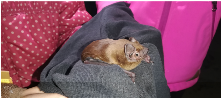
SLIKA 20. Izpust samice navadnega mračnika ( Nyctalus noctula ), poimenovane Nela.

Po naključju sem novembra 2019 v tunelu v vasi Sela na tleh sredi dneva našel netopirko, ki sem ji dal ime Orla. Začel sem se spraševati, od kod je prišla. Nato sem ugotovil, da je padla iz ene od špranj, ki so na stropu tunela. Zavil sem jo v jopico in jo odnesel domov. Poklical sem svojo teto Majo in ji rekel, da sem našel netopirja in da naj ga pride pogledat. Prišla je in mi povedala, da je to netopir, imenovan navadni mračnik. Maja je netopirko vzela k sebi in zanjo skrbela do februarja 2020, nakar sva jo izpustila nazaj v tunel, kjer sem jo tudi našel. Ko sva jo izpustila, sva videla, v katero špranjo je odletela. Pogledala sva v to špranjo in ugotovila, da je v njej zelo veliko navadnih mračnikov. To je bil razlog, da mi je teta Maja predlagala, da bi skupaj spremljala številčnost netopirjev v tunelu.