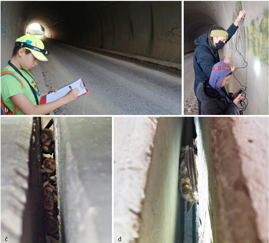
SLIKA 21. a) Spreminjanje števila navadnih mračnikov ( Nyctalus noctula ) od septembra 2020 do maja 2021 v tunelu pri vasi Sela pri Lavrici (Škofljica), b) ob začetku opazovanj je bilo treba narediti skico tunela, c) pozoren pregled špranj z boreoskopom, č) skupinica navadnih mračnikov, d) nekajkrat so bili v špranjah tudi posamični navadni/ostrouhi netopirji ( Myotis myotis/oxygnathus ).