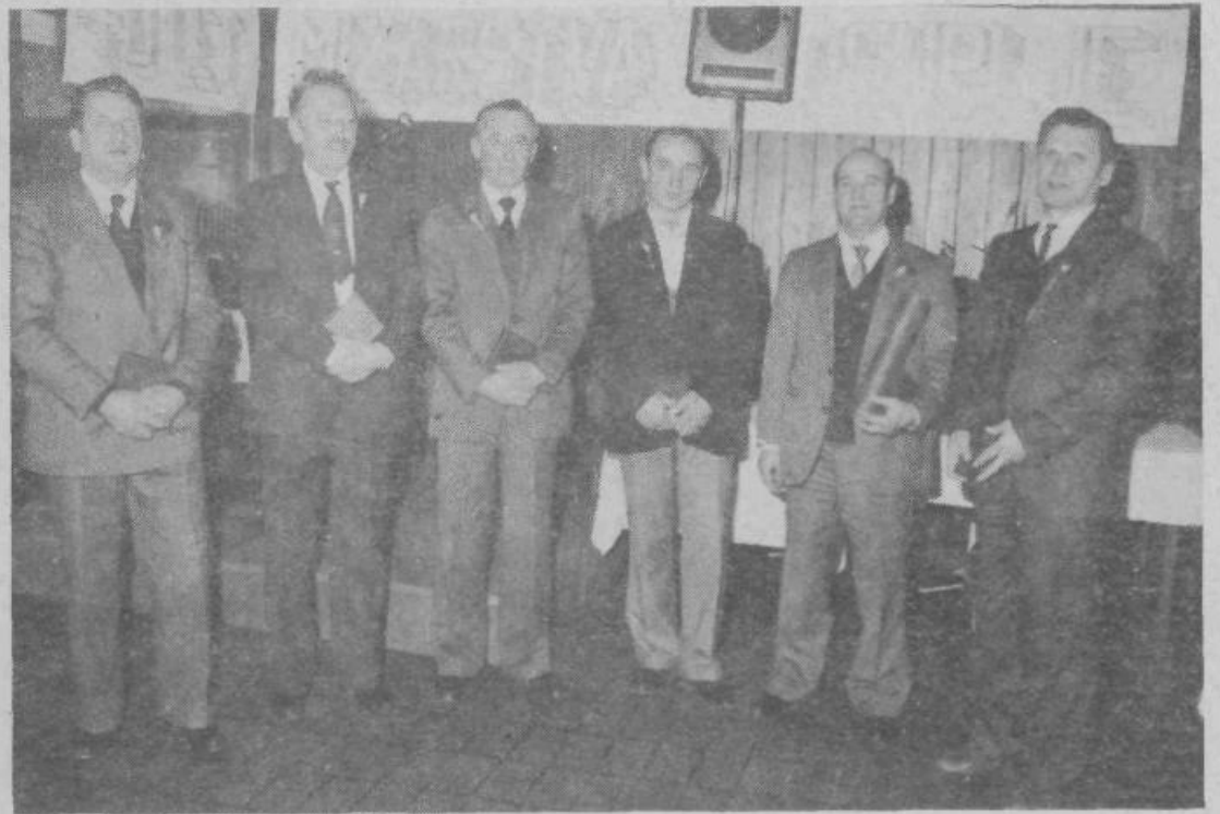
Plakete in priznanja v pravih rokah

V vseh letih so delavci posvečali veliko pozornost ne samo skrbi za čim boljši dohodek, ampak tudi urejanju družbenoekonomskega odnosa v te-