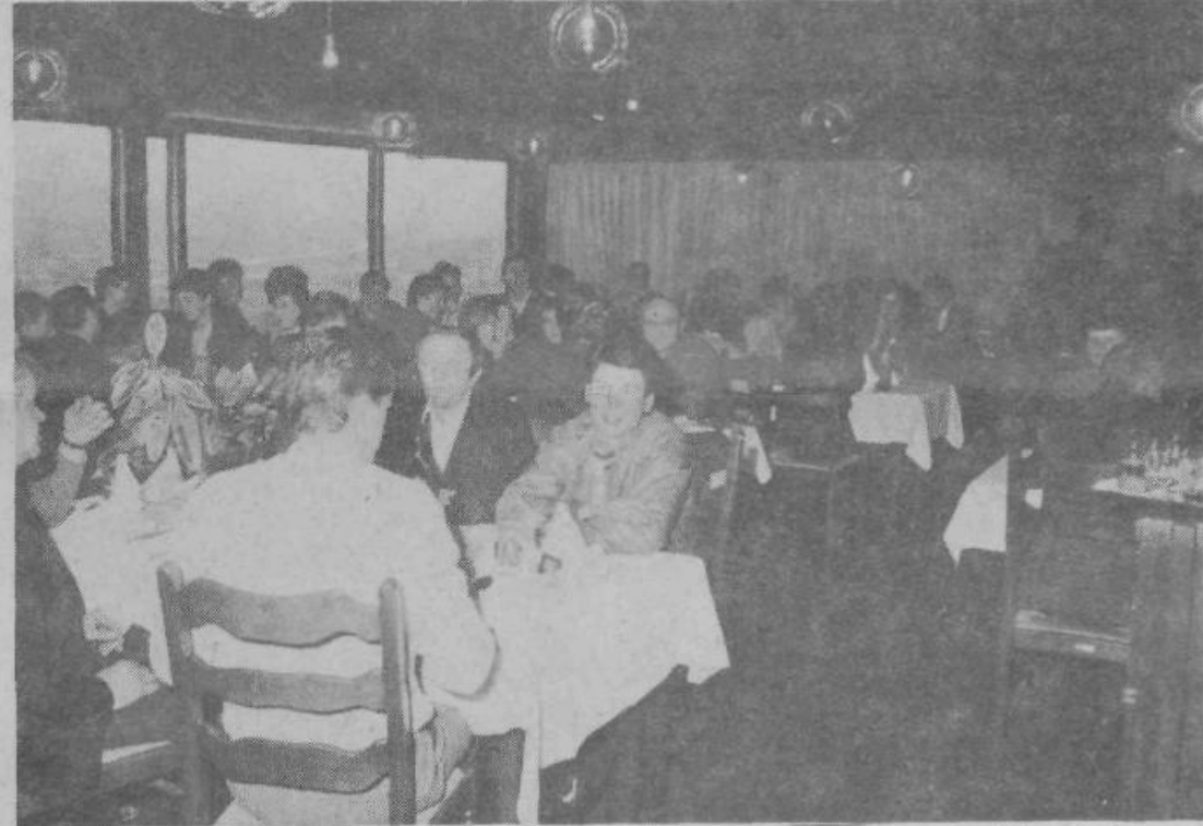
Delavci Splošnega mizarstva so ob dobrih doseženih rezultatih z zadovoljstvom praznovali