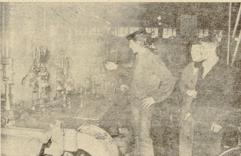
Mladi delavci iz TOZD 2 pri vsakdanjih opravilih na avtomatih