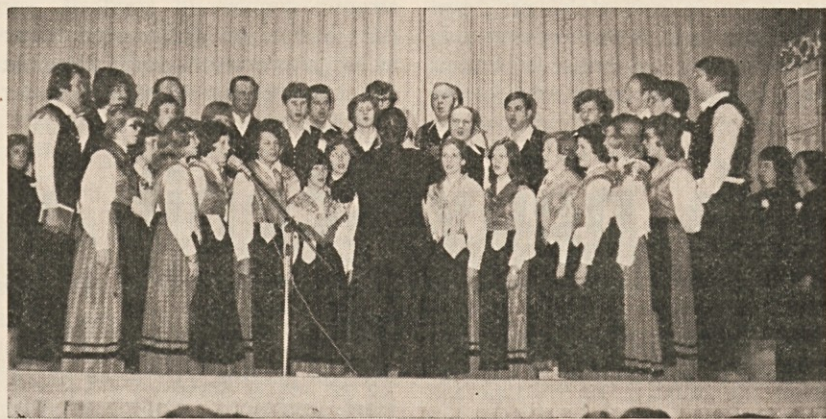
Moški zbor „Vinko Poljanec“ in mešani zbor „Danica“