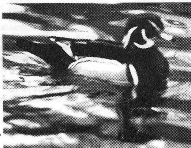
3., 4. Račka nevestica na Bledu, dne 22. 3. 1978 3., 4. Wood Duck in Bled on 22 nd March 1978