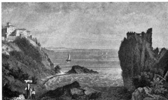
Devinski grad; desno stari grad v razvalinah, v ozadju Trst