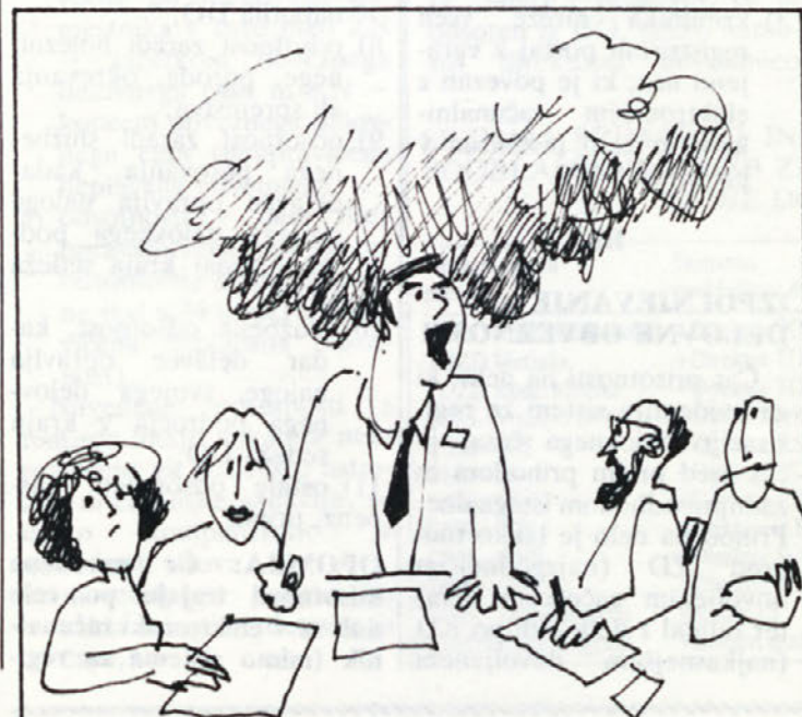
RECIMO MALO PA PRAVO