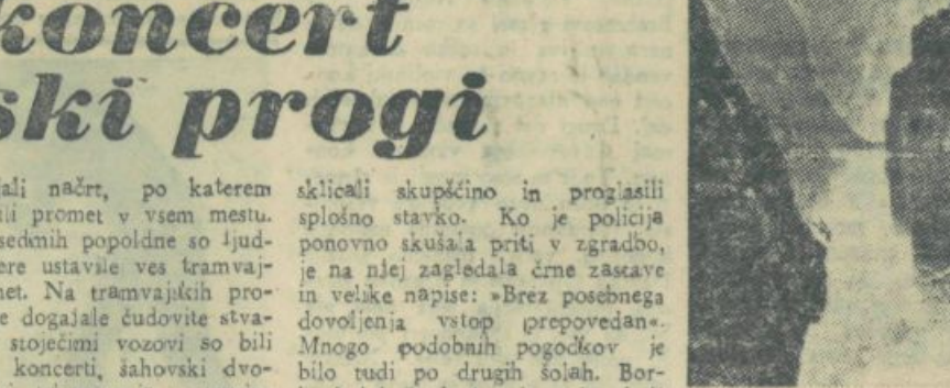
Nearš fjord v Norveški

gijo. Te stroke doma ne morejo študirati, ker so univerze prenapolnjene. Pri tem pa se pojavlja vprašanje, če bodo njihove diplome na Norveškem sploh priznali in če bodo lahko po končanih študijah dobili zaposlitve v domovini. Da bi se porazgovorilo o vsem tem, so se zbrali letos septembra v Oslu predstavniki norveških študentov z 30 univerz iz vse Evrope. Ustanovili so Zvezo norveških študentov v tujini, ki se bo skupno z norveško nacionalno zvezo študentov borila za izboljšanje položaja študentov, ki študirajo v tujini. Zopet filozofija na prvem mestu Polovica mladih ljudi, ki obiskuje neko visoko šolo v Veliki Britaniji, ne študira niti tehniško niti kako drugo praktično, moderno stroko, temveč filozofijo. O tem presenetljivem dejstvu se lahko prepričamo v letnem poročilu finančnega ministrstva za leto 1954-55. V Veliki Britaniji je bilo v preteklem letu 81.705 imatrikuliranih študentov. Od tega jih 35.000 študira filozofijo, 17.327 prirodoslovje, 13.098 medicino, 10.588 tehniko in 1.927 agronomijo. Od vseh študentov jih sprejema 59.563 (75 %) finančno podporo v Nemčiji in vožnjo po Renu.