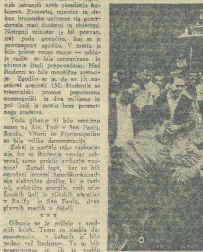
Sanovski dvoboj sredi ulice je privabil mnogo opazovalcev...