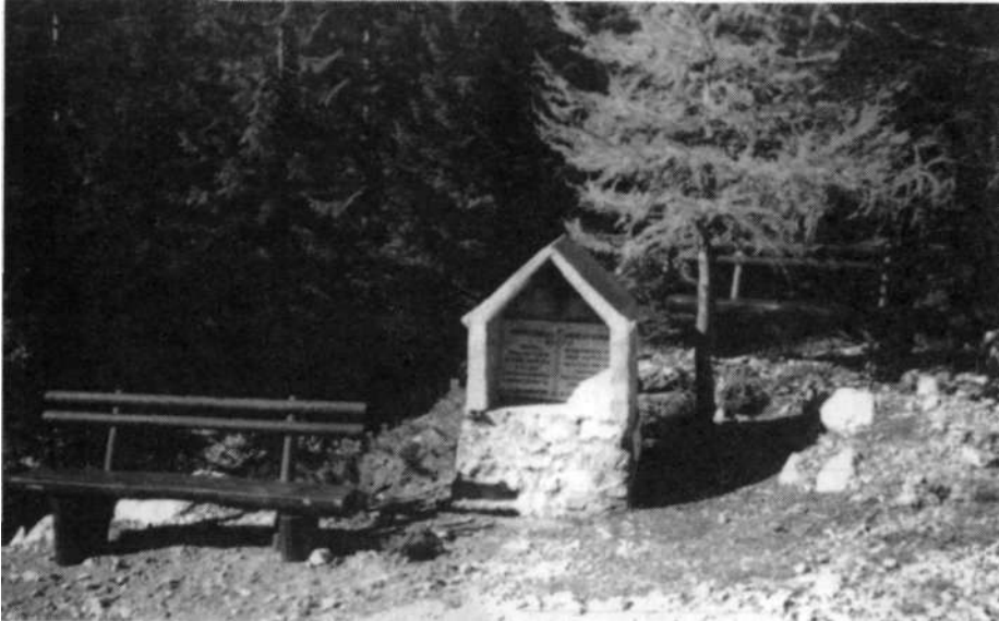
Postoj, popotnik, sedi in premišljuj.