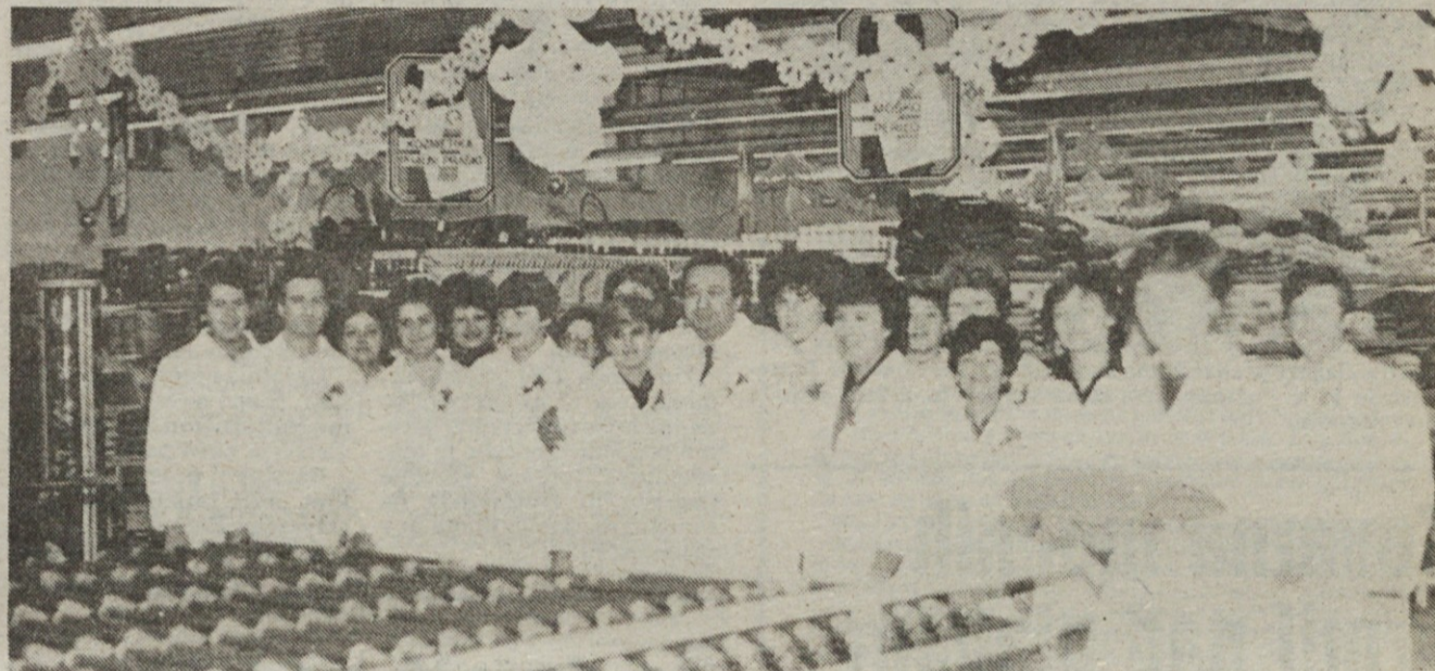
Delovni kolektiv novega E-centra v Fužinah