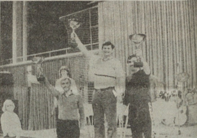
Spominski posnetek iz celjskega Golovca, kjer so bile v mesecu maju letne športne igre Emone. Pokale najboljšim.