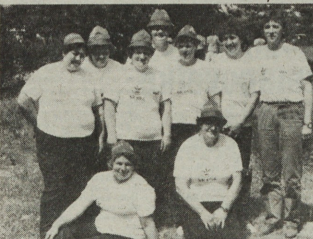
Ekipa Ptujčank iz Kmetijskega kombinata, ki v vlečenju vrvi nima tekmeča.