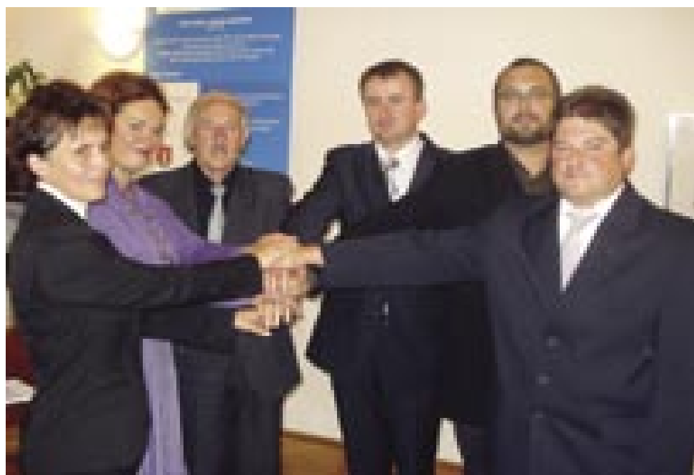
Partnerji pri projekti Saused k sausedi – Razvojna agencija Slovenska krajina, Center za zdravje in razvoj Murska Sobota, Državna slovenska samouprava, Občina Gornji Senik, Javni zavod Krajinski park Goričko in Občina Dolnji Senik

Človek se ponavadi po tašni tiskovni konferenci pita, ka konkretno ostane po projekti v Porabji. Pri tom projekti leko povejmo, ka de skurok vsakša porabska ves kaj profitirala. Pa začnimo pri Gorenjom Seniki. Tü ta dve investiciji. Na enom tali se obnavi kulturni daum, gde do leko meli kulturne programe, delavnice (műhelyfoglalkozások) za mlajše pa