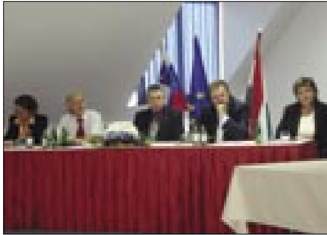
Delovno predsedstvo posveta