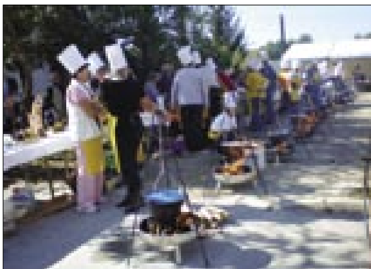
Tak povrsti so stali bogračke, v steraj so ekipe pripravile dödöle

in tau v paudrügi vöri. Med tjöjanjom te pa skaus gleda lüstvo, žirija odi gora-dola, ka delaš, ka nöjcaš pa kak. Müve sva gora ponöjcale tri kile kromča pa skur kilo mele, lük pa žir. V bograči tjöjano djesti je prej furt bagušo od tiste sage po dimi, rejsan. Zvöjn naja je ništje nej pražo dödöle, ka v Prekmurji dödöle méko djejo z lükom ali vrnjim mlejkom pa