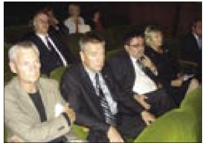
Gostje slavističnega kongresa v Monoštru

Na otvoritvi drugega kongresnega dneva je Slavistično društvo Slovenije podelilo posebna priznanja trem izredno zasluž-