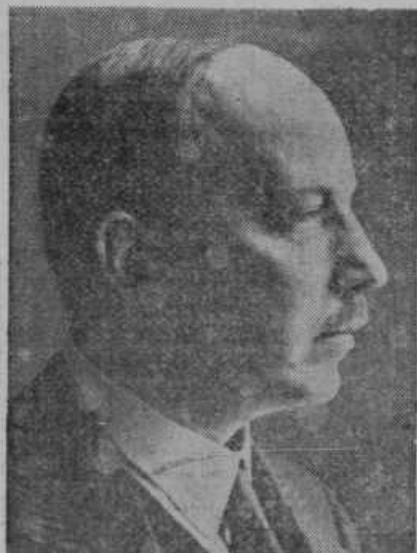
Risto Rytö, predsednik nove vlade na Finskem

Salek pri Večenju. V vsakem oziru izvrstno Stropnikovo hišo obiskuje trpljenje. Neizprosna smrt v njej kruto gospodarji. V kratkih letih je umrlo v tej hiši kar pet ljudi. Prvi je bil oče