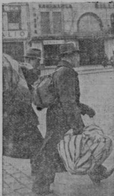
Finska pošilja civilno prebivalstvo iz mest v notranjost dežele

Galicija pri Celju. Leto 1939 se bliža h koncu. Zopet bo treba obnoviti naročnino za naše liste. Naša župnija, ki šteje nad 1700 duš, ima 350 hišnih števil, kamor prihaja nad 400 naših katoliških časopisov, tako da pride na vsako hišo več kot en časopis. Zastavo nosi seveda naš priljubljeni »Slovenski gospodar«, ki nas zvesto obiskuje že skoro trideset stoletja. Precej pa je