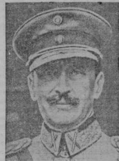
Maršal Gustav Mannerheim vodi obrambo Finske

Šmartno pri Slovenjgradcu. V nedeljo, 3. decembra, je priredilo naše Prosvetno društvo v družbi s FO in DK pester Miklavžev večer. Obdarovani so bili vsi malčki z lepimi darili. V ta namen so priredila dekleta zbirko in ob tej priliki pokazala, kaj zmore dobra volja. Vsi, ki ste kaj darovali, iskreno zahvaljeni! — Na praznik Brezmadežne je priredil FO in DK lepo uspelo akademijo. Na z izbranimi točkami bogatim sporedom so bile izvajane lepe simbolične, ritmične in proste vaje. Društvi, ki sta s to lepo prireditvijo nudili številnim obiskovalcem lep užitek, zaslužita priznanje! Čisti dobiček se bo razdelil za božičnico našim farnim in občinskim revežem.