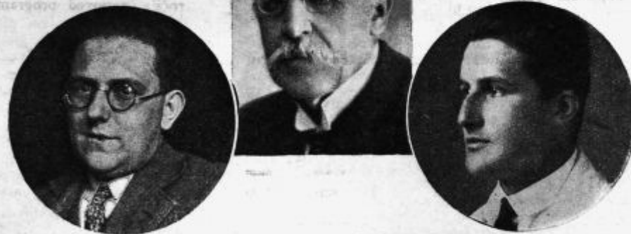
K zdravstvenim predavanjem v našem radlu.