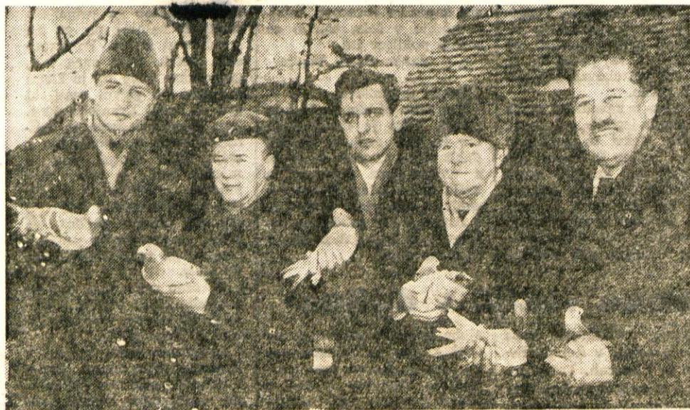
Člani kranjskega kluba rejcev golobov pismoš pred odhodom svojih pernatih prijateljev na olimpiado.