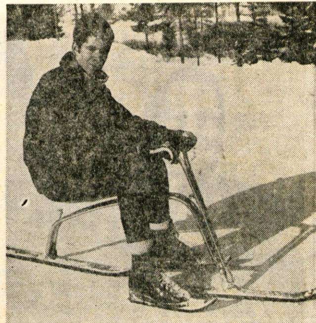
Čudno vozilo, na katerem sedi fant, se imenuje ski-bob. Nekakšen kržanec med sanmi in smučmi je. Vožnja z njim zahteva kar precej spretnosti — nič manj kot smučanje.

(Duplje), 3. Mohorič (Tržič), 4. Faganel (Podnart), 5. Zalokar (Križe), 6. Klančnik (Duplje), 7. Stare (Olševek), 8. Jazbec (Križe), 9. Hvastil (Triglav), 10. Pirih (Podbrezje) itd.