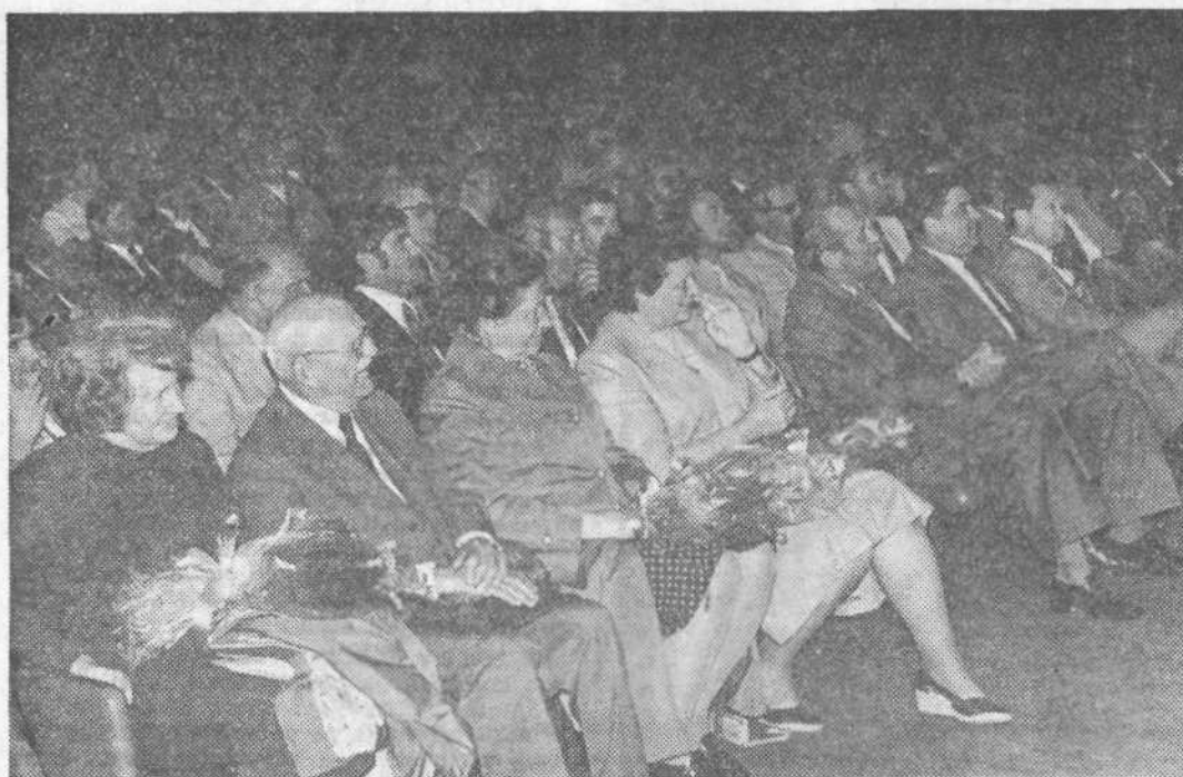
Slavnostne seje delegatske skupščine in vodstev DPO so se udeležili ugledni gostje.

V okviru praznovanja občinskega praznika so delavci Integrala, tozđ Delavnice slovesno predali namenu novo halo obrata za tehnične preglede vozil. Objekt, ki je veljal 24 milijonov dinarjev, predstavlja veliko pridobitev za številne lastnike raznih vozil, za delavce Integrala pa veliko boljše delovne pogoje.