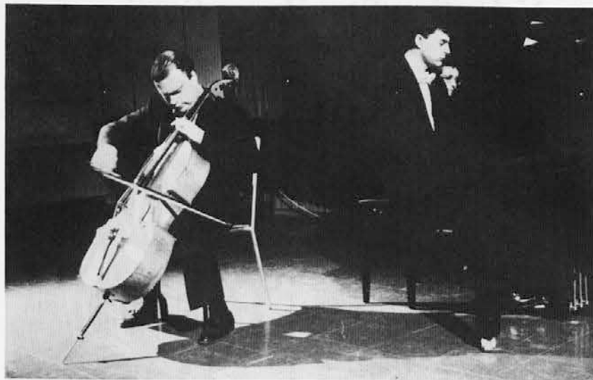
Posnetek s koncerta v Sedejevem domu v Števerjanu

Na prvem srečanju Mladih zvočkov v Sedejevem domu v Števerjanu se je prejšnji torek zbralo kar lepo število mladih poslušalcev - učencev glasbenega centra Emil Komel, ki so s svojimi starši in prijatelji prisluhnili protagonistoma večera: čelu in klavirju.