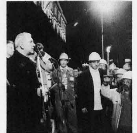
Škof L. Bellomi na Velikem trgu