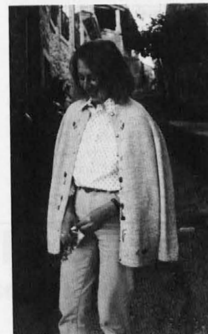
Loparska hči v svojem okolju

smo iskali lepote in užitke drugje, se sramovali in zatajili svoj dom ter kljub vsemu in končno našli srečo le doma. Loparska hči