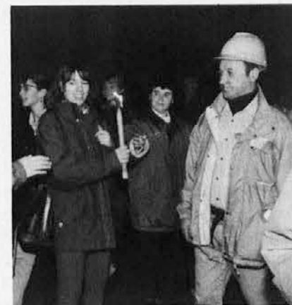
6 km dolga človeška veriga