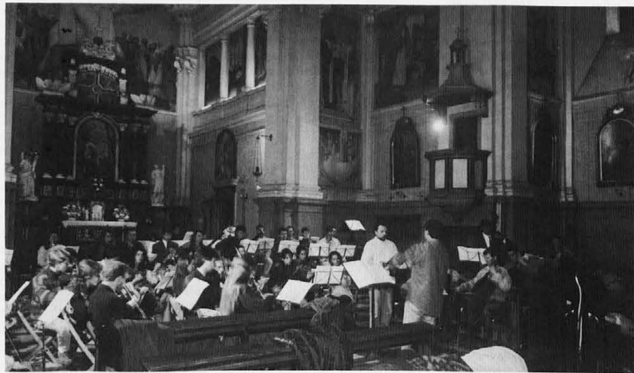
Orkester in solisti med vajami v štandreški cerkvi