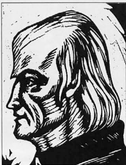
Upodobitev Valentina Staniča