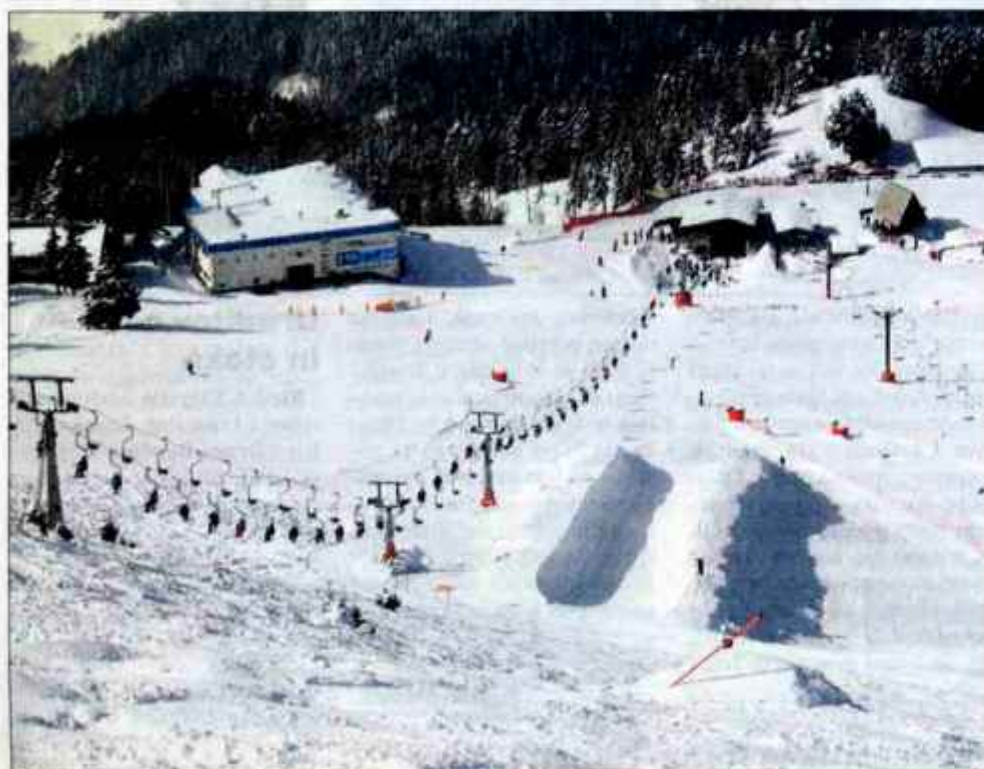
Zimska podoba Krvavca.

V torek se je končno potrdilo dolgo pričakovano ugibanje o tem, ali bodo resnično uspešni upravljavci znanega smučišča Rogla in zdravilišča v Zrečah pod Pohorjem iz Uniorja Turizem prevzeli krmilo tudi na Krvavcu. Kljub temu da je RTC Krvavec nedvomno osrednje smučišče slovenske prestolnice in vsaj za polovico Gorenjske, so ga investicije po pogojih, ki so za tovrstno infrastrukturo v Evropi nepojmljive, ter zaporedje katastrofalno zelenih zim, potisnile na kolena. Ljubljana in Gorenjska pa sta mu obrnili hrbet. (Do)Sedanja lastnica SKB banka, ki je po naravi stvari za to, da "dela" denar, si pravzaprav zasluži priznanje, da ni, podobno kot njeno okolje, vsega skupaj poslala v stečaj in naprave prodala, pač pa po nedvomno težkih iskanjih in pogajanjih našla kupca, ki se na dejavnost spozna in se je pri tem že izkazal. Da so bile resnično raziskane različne možnosti, se kaže spomniti tudi na pogajanja s