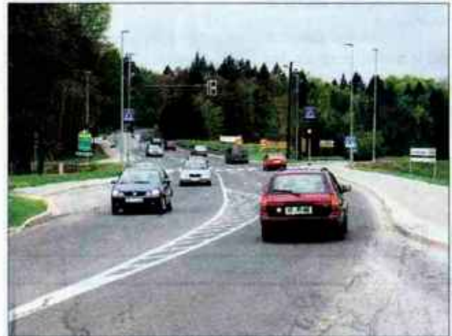
Semaforji v podvinskem križišču bodo začeli delovati konec prihodnjega tedna.

bodo začeli delovati 15. maja. Semaforizacija podvinskega križišča je stala okrog 10 milijonov tolarjev, na vprašanje, zakaj se niso odločili za gradnjo križišča, pa so na omenjeni direkciji odgovorili, da slednje ne bi bilo upravičeno, semaforizacija pa je začasna rešitev do začetka gradnje gorenjske avtoceste. Odslej bodo pešci varneje pre-