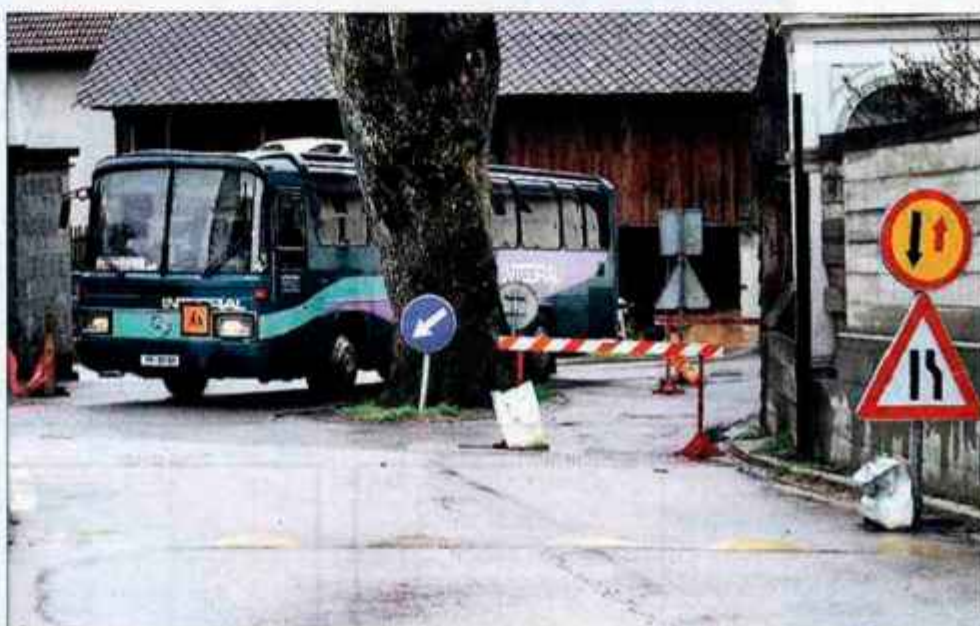
Avtobus se lahko skozi središče Loma prebije le s spretnimi manevri.

od leta 1958. Občina je cesto v preteklosti večkrat obnavljala, nazadnje jo je preplastila leta 1996, večjo rekonstrukcijo pa opravila v začetku devetdesetih let. Takrat so naredili tudi izmere, lastniki zemljišč pa so podpisali soglasja, da se z njimi strinjajo. Pozneje so opravili cenitve in z lastniki sklenili kupoprodajne pogodbe za ustrezne odškodnine. Tudi omenjeni lastnik je leta 1990 soglašal z izmero, pozneje pa si je premislil in na sodišču vložil izvršbo. Dve parcelni številki tedaj nista bili vključeni v kupoprodajno pogodbo in ta pomanjkljivost se občini sedaj otepa. Ob vložitvi