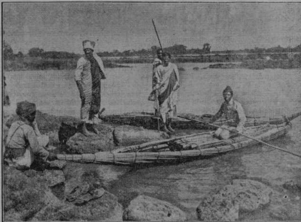
Tana jezera, katerega so zasedli Italijani in iz katerega izvira Modri Nil.

Trdnjava na severni meji iz dobe 500—100 let pred Kristusom. V Ceršaškem gozdu v takozvanih Železnih vratih v župniji št. Ilj v Slov. goricah sta odkrila starinoslovec dr. W. Šmid (iz Gračca) in znani mariborski profesor Baš ilirsko gradišče, ki spada v dobo 500—100 let pred Kristusom. Prva odkopavanja so razkrila samo glavne obrise in dokaze, da gre za res veliko utrjeno točko, ki je branila pred prihodom Rimljanov v naše kraje ilirsko pleme pred vpadi Kelto. Omenjeno gradišče leži tako, da ga deli