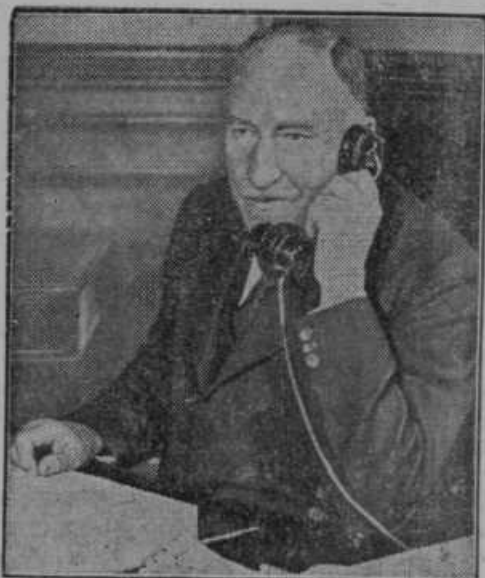
Novi angleški šef generalnega štaba Cyril Deverell.

predčasno eksplodirala in mu razmesarila desnico.