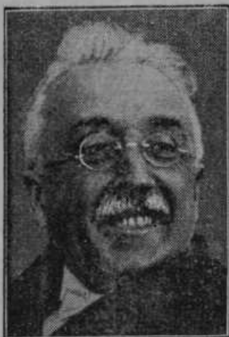
Alcalá Zamora, predsednik Španije, katerega so odstavili njegovi najožji levičarski zavezniki.