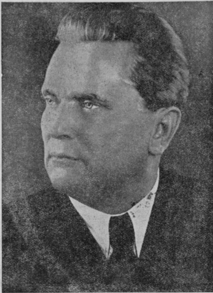
Delavsko naselje pod daljnovo-dom, ki nima elektrike