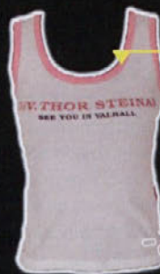
ŽENSKI TOPI velikosti S-L; sestava: 95% bombaž, 5% elasthan redna cena: 1.150 SIT cena s popustom: 805 SIT