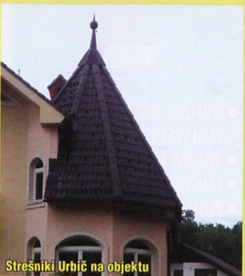
Strešniki Urbič na objektu