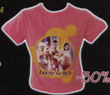
MAJICA BEPOP velikosti 4-12 let; sestava: 100% bombaž redna cena: 1.490 SIT cena s popustom: 1.043 SIT