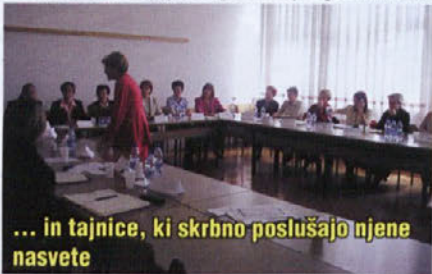
... in tajnice, ki skrbno poslušajo njene nasvete

Tajnice so se udeležile tudi 12. kongresa tajnic, ki je potekal v Portorožu. Tam so poslušale predavanja s področja splošne razgledanosti, se naučile novih veščin komuniciranja, javnega nastopanja ter način kako se bolj povečati poslovno odličnost. Seznanile so se s prenovljenim Kodeksom etike tajnic in poslovnih sekretarjev, v katerem so zajeta ravnanja tajnic za družbo poslovne odličnosti. Zanimivo je bilo predavanje o protokolarnih