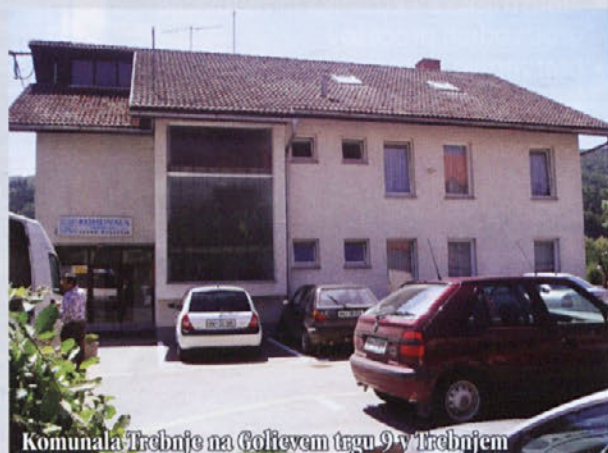
Komunala Trebnje na Golčevem trgu 9 v Trebnjem