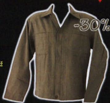
MOŠKA JAKNA velikosti M-XL; sestava: 100% bombaž redna cena: 3.990 SIT cena s popustom: 2.793 SIT