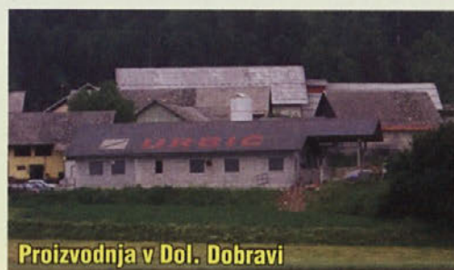
Proizvodnja v Dol. Dobravi