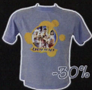
MAJICA BEPOP velikosti 4-12 let; sestava: 100% bombaž redna cena: 1.490 SIT cena s popustom: 1.043 SIT

S 30% POPUSTOM VAS VABIMO NA VROČO POLETNO AKCIJO